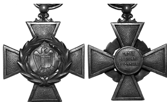
Ил. 20. Военный крест Легиона французских добровольцев против большевизма. 1942–1944.

Кстати, раз уж вспомнили о Наполеоне, то пора сказать и о французских наградах. Формально режим Виши проводил политику нейтралитета, но фактически сотрудничал с нацистской Германией и Японией. Среди наград вишистов отметим Военный крест Легиона французских добровольцев против большевизма 13 (официальное наименование в вермахте – 638-й пехотный полк), который был учрежден 18 июля 1942 г. коллаборационистским правительством Виши (ил. 20). Крестом награждались воевавшие на стороне гитлеровской Германии члены Французского легиона. Первое награждение этим военным крестом имело место 27 августа 1942 г. во дворе парижского Дома инвалидов. После свержения во Франции правительства Виши, т.е. с 7 января 1944 г., ношение этого Военного креста было запрещено. Военный крест легионеров был украшен сверху лавровым венком с сидящим на нем и смотрящим влево орлом. На груди орла – щит с надписью “France”. Считается, что было менее 400 награждений этим типом креста (при общей численности прошедших через LVF в 1941–1944 гг. в 7 тыс. человек).