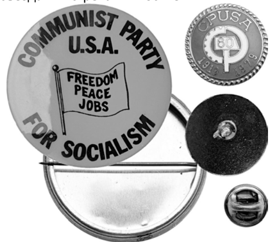
Ил. 53. Знаки коммунистической партии США. КМТ.

Продавать значки не приходилось точно, но вот дарить их можно было и представителям самых разных компартий мира, в том числе и на партийных съездах и встречах в Москве.