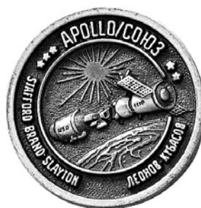
Ил. 50. Знак полета «Союз-Аполлон» американского производства 28 . Аверс.

Ярким примером советики в фалеристике являются значки «рукопожатия в космосе» – совместного экспериментального пилотируемого полета советского космического корабля «Союз-19» и американского космического корабля «Аполлон» (ил. 49 на с. 64), осуществленного 15 июля 1975 г. Полувек юбилей этого события мы отмечаем в этом году. Сама программа была утверждена 24 мая 1972 г. Соглашением между СССР и США о сотрудничестве в исследовании и использовании космического пространства в мирных целях.