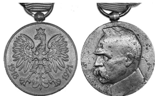
Ил. 2. Польские памятная медаль «Участнику войны. 1918–1921» (слева) и медаль «10-летие обретения независимости» (справа). КМТ.

Ряд финских наград связаны с военными действиями с нашей страной. 3 Это советско-финский