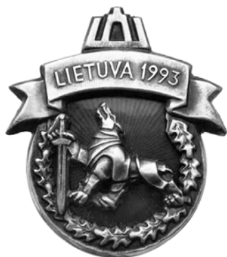
Ил. 55. Литовский знак вывода российской армий с территорий Литовской Республики. 1993 г.

В связи распадом СССР появились всякого рода иностранные знаки и награды недавних частей одного государства. И тут мы вправе вновь говорить о россияке, пусть и болезненной для нас, как граждан России. Например, в Литве был выпущен знак вывода российской армий из территорий Литовской Республики в 1993 г., который вручался литовским должностным лицам, которые внесли вклад при выводе «чужих войск» (ил. 55). Было вручено 399 знаков, что говорит о «масштабности» действия.