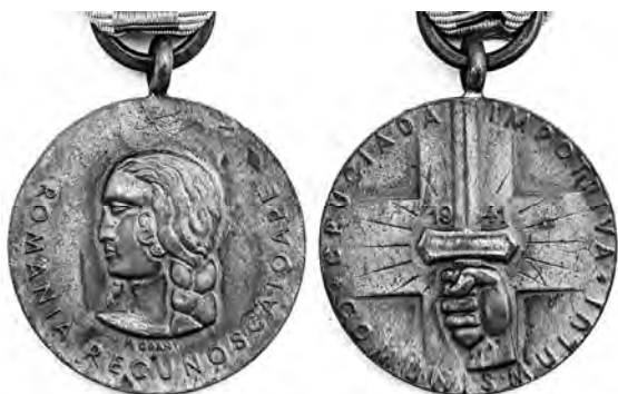
Ил. 16. Румынская медаль «Крестовый поход против коммунизма» немецкого производства. 1942 г. КМТ.

1941 г., а в 1943 г. под Сталинградом почти все привезенные итальянцы закончились. А к 45-летию событий был съезд. Можно было бы эмоционально назвать награду как «медаль в память о съезде недобитых РККА в СССР итальянских фашистов».