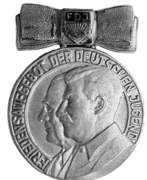
Ил. 29. Медаль ГДР «Акция за мир Союза немецкой молодежи». 1950 г. Аверс. КМТ.