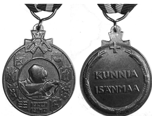
Ил. 5. Финская медаль «За Зимнюю войну» (у коллекционеров – «Кукушка»); могла быть с планками: за участие в боевых действиях (меч и сабля) и с указанием мест: “Karjalan kannas” (Карельский перешеек) или “Summa” (Сумма – поселок в 35 км от Выборга). 1940 г.

★ В соответствии с требованиями ст. 20.3 КоАП РФ на лицевой стороне знака удалено изображение атрибутики, признаваемой нацистской. ★