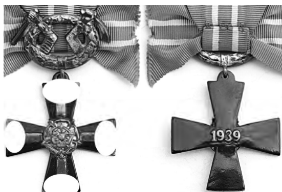
Ил. 4. Финский орден Крест Свободы 4-го класса (воинской) выпуска 1939 г. (Зимняя война). КМТ.

★ В соответствии с требованиями ст. 20.3 КоАП РФ на оборотной стороне знака удалено изображение атрибутики, признаваемой нацистской. ★