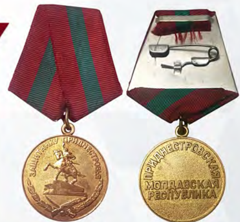
Ил. 56. Медаль ПМР «Защитнику Приднестровья» ПМР. 1993 г.