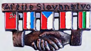
Ил. 25. Чехословацкий знак «Ať žije slovanstvo» (чеш. «Да здравствует славянство!») с флагами СССР, Югославии, Чехословакии, Польши, Болгарии; скорее всего приурочен к Славянскому съезду в Белграде 8–11 декабря 1946 г. КМТ.