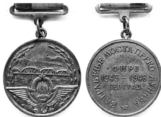
Ил. 24. Памятный югославский знак «За восстановление моста через р. Дунай в Белграде». 1946г. КМТ.

Кстати, именно в Белграде состоялся Славянский конгресс с участием представителей СССР, Югославии, Чехословакии, Польши и Болгарии. К этому конгрессу выпускались памятные знаки в Югославии и, вероятно, в Чехословакии (илл. 25 и 26 на с. 63).