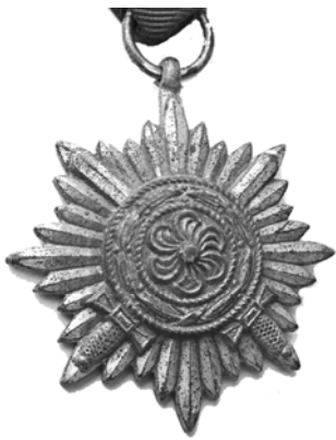
Ил. 21. Немецкий знак отличия для восточных народов II класса «в серебре» с мечами (для комбатантов и бойцов вспомогательной полиции).

точных народов» (ил. 21), это наградной знак Германии времен Второй мировой войны, учрежденный 14 июля 1942 г. В контексте статута категории, которых могли наградить данным знаком отличия: туркестанские подразделения, казачьи части, восточные легионы, добровольцы в составе немецких формирований. С мая 1943 г. в этот список были включены и служащие из состава шутцманшафта, полицейских и охранных формирований. Знак имел в целом невыразительный дизайн. То, что он был учрежден именно в форме звезды (а не креста), с отсутствием на нем свастики (имевшейся почти на всех германских наградах нацистского периода), с использованием ленты зеленого цвета разных оттенков, — объяснялось тем, что данная награда предназначалась в том числе лицам мусульманского вероисповедания. Но сегодня эта награда совершенно правильно воспринимается с презрением именно как знак коллаборантов, т.е. пособников нацистов. Собственно, в некотором роде, эту награду можно сравнить с орденом Иуды, сделанным Петром I для Мазепы. Но тут «иуды» добровольно на себя цепляли вручаемые им «блестяшки». Из-за отсутствия свастики, в ФРГ эта награда не была запрещена (или снова разрешена) к ношению в изначальном виде с 1957 г.