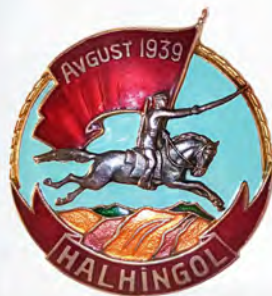
Ил. 8. Монгольский знак «Участнику боев у Халхин-Гола»; учрежден Указом Великого Народного Хурала МНР 16 августа 1940 г. Аверс. КМТ.