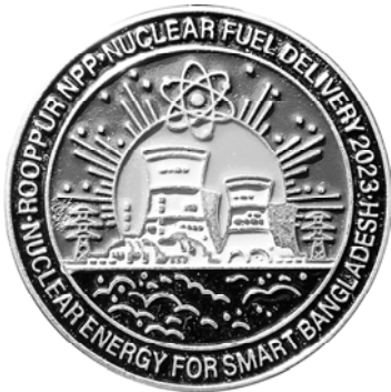
Ил. 59. Знак Бангладеш «АЭС Руппур. Поставка ядерного топлива в 2023 г. Ядерная энергетика для “умного” Бангладеш». КМТ.

Заметной на мировой арене является деятельность Госкорпорации «Росатом», объединяющей более 400 предприятий атомной отрасли. В состав «Росатома» входят все гражданские атомные компании России, предприятия ядерного оружейного комплекса, научно-исследовательские организации, а также атомный ледокольный флот. «Росатом» управляет атомными электростанциями России. Госкорпорация является лидером мировой атомной промышленности. Российскими специалистами или при их участии были спроектированы и построены атомные электростанции в Иране, Индии и Китае. Кроме того, приняты ключевые решения о строительстве новых АЭС по российским проектам в Иордании, Казахстане и Бангладеш. АЭС «Руппур» – строящаяся атомная электростанция (АЭС) в республике Бангладеш. Такие проекты также находят отражение и на значках (ил. 59).