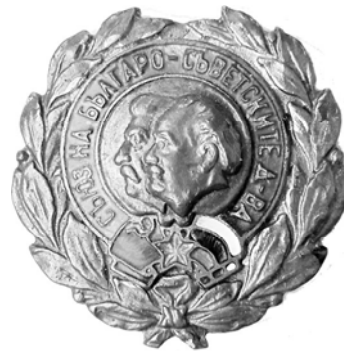
Ил. 28. Болгарский почетный знак Общества болгарско-советской дружбы. 1946–1953 гг. Аверс. КМТ.

Ввиду попадания в орбиту влияния СССР стран Восточной Европы, многие предметы являются советикой. На первых порах появляется как символ портрет И.В. Сталина – так, к примеру, на ряде знаков, представленных на илл. 28–30, где профиль И.В. Сталина изображался вместе с профилем местного руководителя.