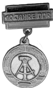
Ил. 32. Знак в память 10-летия образования Германской Демократической республики. 1959 г. Аверс. КМТ.