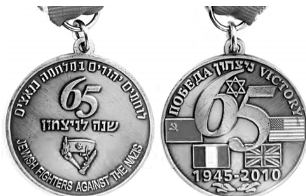
Ил. 57. Израильская медаль к 65-летию Победы над нацизмом. 2010 г. КМТ.

Позитивными примерными являются израильские медали Союза воинов и партизан, инвалидов войны с нацизмом (jewish fighters against nazis) 30 , изготовленные к 45, 50, 55, 60, 65, 70-летию Победы. Отметим, что на медали 50-летия Победы флаг СССР еще был спрятан по флагами США, Великобритании и Франции. На медалях 55-, 60-, 65-летия — флаг СССР выходит на первое место. А на медали 65-летия в 2010 г. появляется помимо слов на иврите «יְהוּדִים נִלְחָמוּ בַנַּאֲצִים» и английским «Victory» — русское «Победа» (ил. 57).