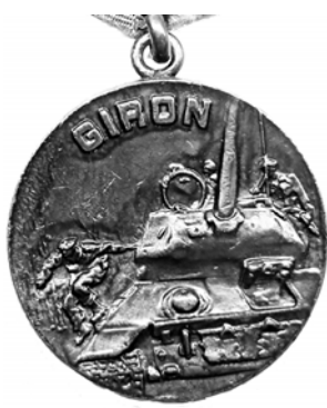
Ил. 45. Кубинская памятная медаль «Победа на Плайя-Хирон». Аверс. КМТ.