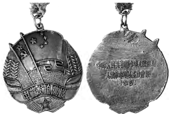
Ил. 39. Медаль КНР «Китайско-Советская дружба», образца 1951 г. КМТ.

жественных событий. 25 Ранние медали имеют на реверсе надписи и датировку (1951 и 1953 годы; ил. 39). После избрания 27 сентября 1954 г. Мао Цзэдуна Председателем КНР появился новый вид медали с гладким реверсом без надписей. Медали такого вида наиболее распространены.