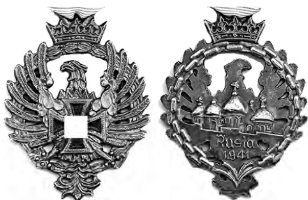
Ил. 19. Франкистская испанская Медаль русской кампании. 1944 г. КМТ.

ступлениях на русской земле. Испанская медаль русской кампании учреждена 9 ноября 1943 г. в качестве памятной военной медали для солдат и офицеров 250-й дивизия испанских добровольцев, более известной в русскоязычных источниках как «Голубая дивизия» испанских добровольцев, сражавшихся на стороне Германии в ходе Второй мировой войны, на русском фронте в период 1941–1944 гг. На лицевой стороне медали, в центре композиции находится орел франкистской Испании с символами испанской фаланги – ярмом и стрелами, поверх которых наложен эмалевый Железный крест со свастикой, что призвано символизировать «братство по оружию» двух народов. Над головой орла возвышается королевская корона Испании.