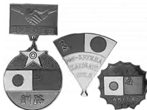
Ил. 52. Япония. Знаки японо-советской дружбы. Аверс. 1972, 1977, 1978 гг. КМТ.

Американцы воспринимали тему проект «Союз-Аполлон» с большим энтузиазмом, но все-таки с меньшим, чем полеты на Луну. Тем не менее, тема широко освещалась в западных средствах массовой информации. Но в то время американцы не имели традиции отражения важных событий на значках, как это было принято в СССР. Кроме того, выпуск таких значков в нашей стране происходил с