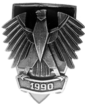
Ил. 33. Памятный знак ФРГ в честь объединения Германии. 1990 г. Аверс. КМТ.

Для таких знаков советика понимается не только как предметы, относящиеся к СССР, но гораздо шире – ко всему социалистическому лагерю.