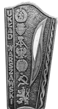
Ил. 31. Польский знак «Варшавский договор». 1970-е гг. Аверс. КМТ.

В Европе у Советского Союза была созданная в ответ на создание НАТО – своя военная Организация Варшавского договора (ОВД), а основной экономической организацией стал Совет экономической взаимопомощи (СЭВ). И иностранные знаки СЭВ и ОВД – типичные фалеронимы, относящиеся к советике (пример на ил. 31). Также и награды стран Восточной Европы, входящих в советский блок, можно относить так, или иначе, к связанным с нашей историей. И, к примеру, значок к 10-летию создания ГДР (ил. 32) – не только про Германию, но это и советика, поскольку ГДР создавался силами советских специалистов и немцев, воспитанных и получивших образование в СССР. Соответственно, и знак в честь объединения Германии (а по сути – аншлюса и ликвидации ГДР; ил. 33) – советика, причем символ позорного ухода из Европы и отставления наших сторонников на произвол судьбы.