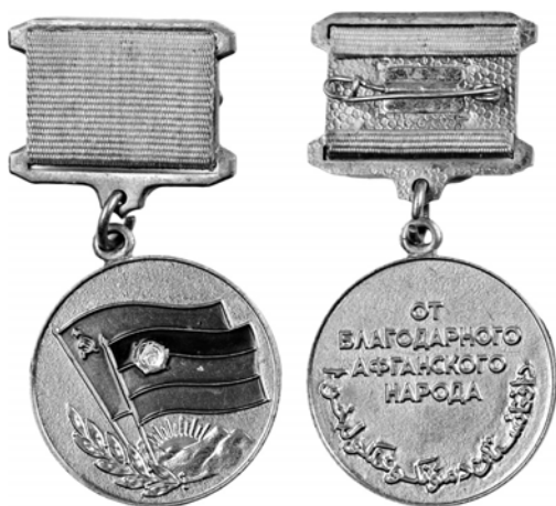
Ил. 47. Афганская медаль «Воину-интернационалисту от благодарного афганского народа». 1988 г. КМТ.

Отдельно отметим еще одну кубинскую награду – медаль «За оборону Куито Куанавале» (ил. 46) 27 . Она была учреждена декретом-законом Государственного совета Республики Куба от 21 марта 1988 г. № 103 в честь героической обороны Куито Куанавале – поселка на юге Анголы, где в 1987–1988 гг. произошли боестолкновения с применением танков, артиллерии и авиации, между Народными вооруженными силами освобождения Анголы, поддерживаемыми кубинскими добровольцами и советскими военными специалистами, с одной стороны, и войсками ЮАР и повстанцами УНИТА с другой. В результате боестолкновений, завершившихся 27 июня 1988 г., войска ЮАР покинули территорию Анголы, начав мирные переговоры. На сегодняшний день известны имена, звания и должности 69 советских военных специалистов, которые были награждены кубинской медалью «За оборону Куито Куанавале».