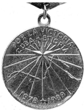
Ил. 43. Кубинская медаль «За Победу Куба – Эфиопия». Аверс. 1989 г. КМТ.