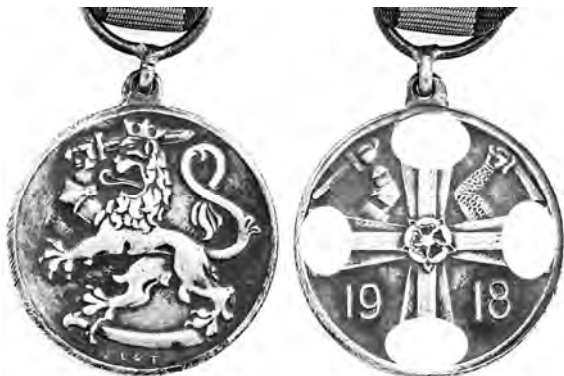
Ил. 3. Финская памятная медаль в честь Освободительной войны Финляндии в 1918 г. КМТ.

вооруженный конфликт 1918–1920 гг., Зимняя война 1939–1940 гг. и «война-продолжение» – советско-финляндский фронт Великой Отечественной войны 1941–1944 гг. (илл. 3–5).