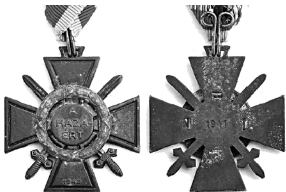
018 Хортистский венгерский Огненный крест I класса (боевой) за кампанию 1942 г. КМТ.

Любопытны и румынские «кульбиты». В 1942 г. была учреждена медаль «Крестовый поход против коммунизма» (ил. 16), которая вручалась военнослужащим всех родов войск румынской и союзных армий (немцам, итальянцам и словакам), а также гражданским лицам, участвовавшим в боевых действиях на Восточном фронте. Ношение медали было запрещено после 23 августа 1944 г., когда Румыния выступила на стороне союзников по антигитлеровской коалиции. Примерное число награжденных