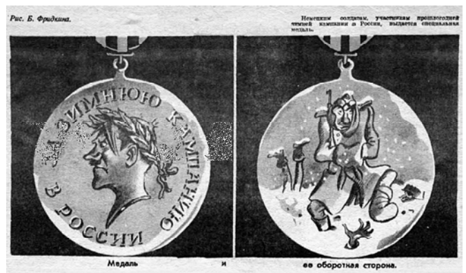
Илл. 11. Карикатура на немецкую медаль «За зимнюю кампанию на Востоке 1941/42». 1942 г. Худ. Б. Фридкин.