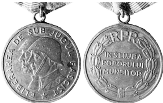
Ил. 17. Румынская медаль «За освобождение от фашистского ига». 1949 г. КМТ.