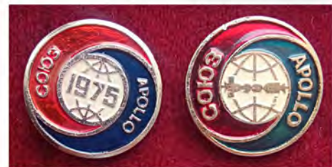
Ил. 49. Сувенирные значки «Союз–Аролло» производства СССР. Аверс. КМТ.