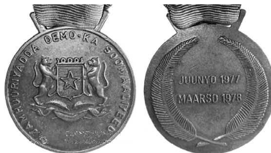
Ил. 42. Сомалийская медаль «Освободительная война Западного Сомали». 1977-1978 гг. КМТ.

В конфликте между Эфиопией и Сомали за контроль над регионом Огаден 1977–1978 гг. в той или иной мере с обеих сторон приняли участие 11 государств, считавших себя социалистическими. Кроме них причастными к конфликту стали и такие страны, как США, Израиль и Иран. Президент Сомалийской Демократической Республики и считавшийся тогда «большим другом Советского Союза» Мохаммед Сиад Барре, даже не пожелав проконсультироваться с советским руководством, принял решение захватить эфиопскую провинцию Огаден военным путем. С июля по ноябрь 1977 г. военные советники СССР были с двух сторон фронта; далее советский континент вывели из Сомали, частично отправив в Эфиопию. Разрыв советско-сомалийских отношений стал одним из самых парадоксальных событий Холодной войны. Эфиопия, прежний союзник США, превратилась в страну социалистической ориентации, а советские военные советники в составе эфиопских войск, вооруженных американским оружием и подготовленных американскими инструкторами, теперь противостояли сомалийской армии, воевавшей по советским военным уставам и советским оружием. На ил. 42 – сомалийская медаль за участие в этой войне.