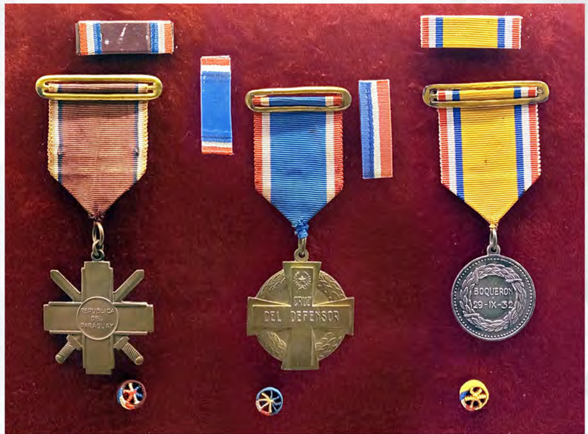
Ил. 7. Государственные награды Парагвая (слева-направо): памятный Чакский крест, Крест Защитника, медаль в память о битве за Бокерон 29.09.1932. Получены русскими офицерами за участие в Чакской войне в 1932–1935 гг. Парагвай. Музей Дома русского зарубежья. Дар Президента РФ.