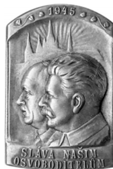
Ил. 30. Чехословацкий знак «Слава нашим освободителям!». 1945–1948 гг. Аверс. КМТ.