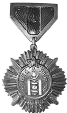
Ил. 34. Монгольская медаль «За победу над Японией». 1945 г. Аверс. КМТ.

Монгольская народная республика учредила медаль «За победу над Японией» (ил. 34) в 1945 г. Множество этих медалей было вручено советским гражданам.