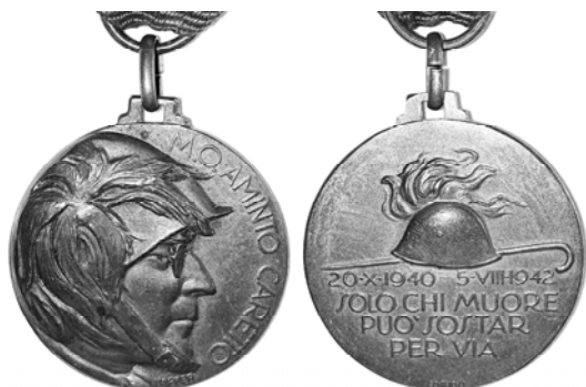
Ил. 13. Итальянская медаль памяти командира 3-го полка берсальеров Аминто Каретто. 1942 г. КМТ.

Нельзя не отметить, что в медальерном искусстве итальянцы являются одними из самых успешных мастеров. Примером может служить медаль памя-