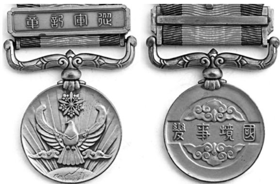
Илл.9. Медаль Маньчжоу-го в память о военном пограничном Номон-Ханском инциденте; учреждена 25 ноября 1940 г. императорским эдиктом № 310. КМТ.

В японской историографии термин «Халхин-Гол» употребляется только для наименования реки, а сам военный конфликт называется «инцидентом у Номон-Хана», по названию ориентирного знака Номон-Хан-Бурд-Обо в этом степном районе маньчжуро-монгольской границы. В фалеристике же это событие отражено с двух сторон, и в обоих случаях – не ведущих, то есть, не среди наград Советского Союза и Японии, а среди наград Монгольской Народной Республики (МНР) и Маньчжоу-го (см. илл. 8 на с. 63 и ил. 9).