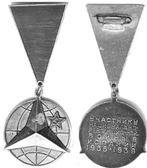
Ил. 38. Памятная медаль Советского комитета ветеранов войны «Участнику национально-революционной войны в Испании 1936–1939 годы». 1967 г. 24

Сразу оговоримся, что из специальных наград за локальные конфликты в СССР было создано немного: памятные медали (1967 г.) и знаки (1987 г.) Советского комитета ветеранов войны «Участнику национально-революционной войны в Испании 1936–1939 гг.» (ил. 38) и знаки «Воину-интернационалисту» (1988 г.), известные уже благодаря многочисленным ветеранам Афганистана, хотя давали их ретроспективно за события 1950–1980-х гг.: Корею, Алжир, Египет, Йемен, Вьетнам, Сирию, Анголу, Мозамбик, Эфиопию, Камбоджу, Бангладеш, Лаос, Ливан. Но не всем успели вручить, а кто-то так и не смог доказать из-за секретности свое право на эти знаки (а, соответственно, и льготы).