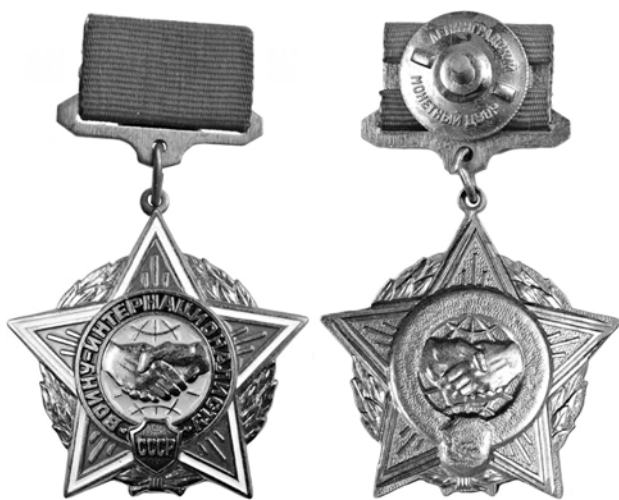
Ил. 48. Знак СССР «Воину-интернационалисту». 1988 г. КМТ.