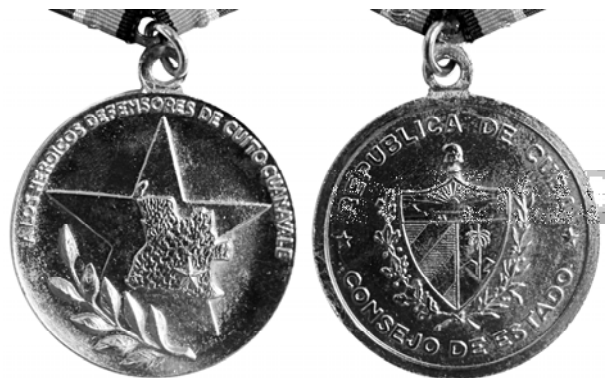
Ил. 46. Кубинская медаль «За оборону Куито Куанавале». 1988 г. КМТ.

Именно эта победа способствовала тому, что в мае 1961 г. Фидель Кастро открыто провозгласил, что Куба пойдет по социалистическому пути развития. Это резко изменило отношение руководства СССР к Кубе. На Остров Свободы отправились советские инженеры, военные специалисты и оружие, чтобы предотвратить повторение интервенции США.