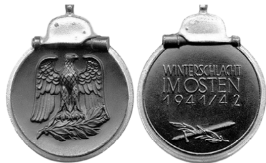
Илл. 10. Денацифицированная немецкая медаль «За зимнюю кампанию на Востоке 1941/42» («Medaille Winterschlacht im Osten 1941/42») образца 1957 г. КМТ.