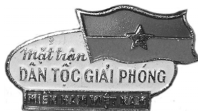
Ил. 41. Знак «Национальный фронт освобождения Южного Вьетнама» (Вьетконг). Аверс. 1962 г. ЛМД. КМТ.

Кстати, для Вьетнама СССР изготавливал знаки Национального фронта освобождения Южного Вьетнама (ил. 41), также как для других национально-освободительных движений, например, для Народного движения за освобождение Анголы – Партии труда.