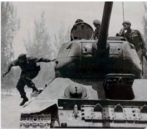
Ил. 45 а. Фидель Кастро спрыгивает с танка Т-34-85 во время операции в бухте Кочинос. 19 апреля 1961 г. Фрагмент (нижняя половина).

СССР на международной арене активно поддерживал как Йеменскую Арабскую Республику, так и Народно-Демократическую Республику Йемен. При этом им оказывалась значительная материальная помощь на безвозмездной основе, а крупные коллективы советских военнослужащих находились с двух сторон.