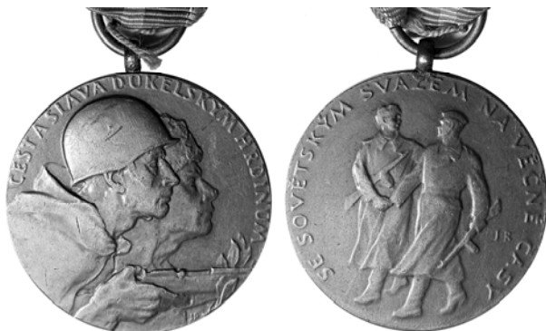
Ил. 27. Чехословацкая Дукельская памятная медаль. 1959 г. КМТ.

Нередко на фотографиях советских офицеров можно встретить Чехословацкий Военный крест 1939–1945 гг., учрежденный еще в 1940 г. правительством в изгнании, разместившемся в Лондоне; после освобождения Чехословакии постановление об учреждении креста было утверждено в 1946 г. Но более «специальной» и массовой является еще одна награда – Дукельская памятная медаль, которая была учреждена 26 июня 1959 г. в ознаменование 15-летия боев на Дукле (ил. 27). Медалью награждались военнослужащие 1-го чехословацкого армейского корпуса, участвовавшие в период 8 сентября – 28 октября 1944 г. в боях на Дукле. Кроме чехословацких граждан, этой медалью было награждено более 10 тыс. советских воинов.