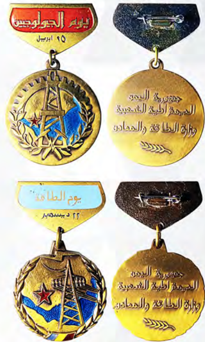
Ил. 44. Знаки Южного Йемена для геологов и энергетиков. Изготовлены в СССР. КМТ.