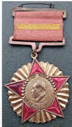
Ил. 37. Медаль КНР «За отражение американской агрессии и оказание помощи корейскому народу. 1950-е гг. Из коллекции П.Е. Лозовского.