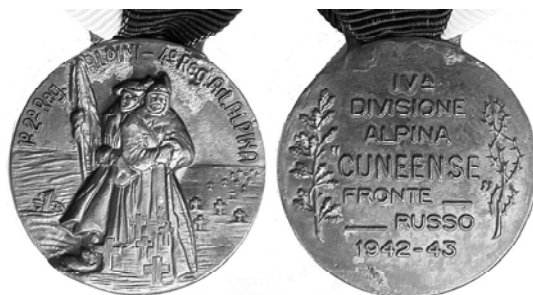
Ил. 14. Итальянская медаль «4-я альпийской дивизия «Кунеэнзе». Русский фронт 1942–43». КМТ.

Кроме этой итальянской награды военного времени есть и другие, но уже не столь давние. Например, ветеранская медаль ветеранов 4-й альпийской дивизии «Кунеэнзе» элитных альпийских горнострелковых частей (ил. 14). Это одна из десяти итальянских дивизий, воевавших на Восточном фронте в СССР (что характерно, итальянцы его звали Русский фронт, а не советский). Дивизия существовала с 1935 по 1943 г. и базировалась в городе Кунео, в честь чего получила свое название. К 11 февраля 1943 г. из 17 460 человек, служивших в дивизии в живых осталось только 1607 человек – они и выпустили медаль. Видимо, уже в 1950–1960-х гг. композиция вполне понятна – обмотанные замороженные итальянцы в русских степях и масса крестов.