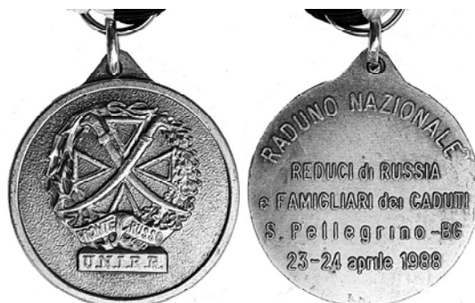
Ил. 15. Итальянская медаль «Национальный сбор ветеранов России и семей погибших в городе Сан-Пеллегрино 23–24 апреля 1988 года». КМТ.

Еще одна итальянская памятная медаль белого металла с подробной легендой «Национальный сбор ветеранов России и семей погибших в городе Сан-Пеллигрино 23–24 апреля 1988 г.»; на аверсе воспроизведена эмблема "U.N.I.R.R." (Unione Nazionale Italiana Reduci di Russia; ил. 15), которая в свою очередь основана на знаке "Fronte Russo" («Русский фронт»). А черно-белая лента – от креста CSIR. То есть, эта была встреча тех, кто приехал к нам в