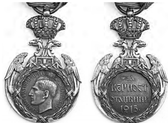
Ил. 1. Сербская Медаль Албанского отступления. 1920 г. КМТ 2 .

В 1928 г. в Речи Посполитой учреждены и отчеканены на Варшавском монетном дворе памятная медаль «Участнику войны. 1918–1921» и медаль «10-летие обретения независимости» (ил. 2). Портрет пламенного ненавистника как Российской империи, так и Советского Союза и автора проекта “Polska od morza do morza” («Польша от моря до моря») пана Юзефа Пилсудского вышел весьма воинственный! На протяжении 1920-х гг. Польша рассматривалась в СССР в качестве наиболее вероятного противника. В свою очередь в Польше также относились к СССР как к наибольшей угрозе.