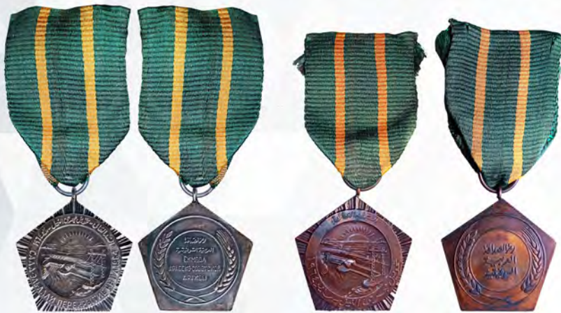
Ил. 40. Медаль Объединенной Арабской Республики «Садд-Эль-Аали» за перекрытие Нила при строительстве Асуанской плотины. Варианты на русском и арабском и только на арабском. 1964 г. КМТ.