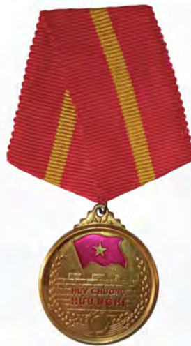
Ил. 40. Вьетнамская «Медаль Дружбы». Аверс. 1960 г. КМТ.