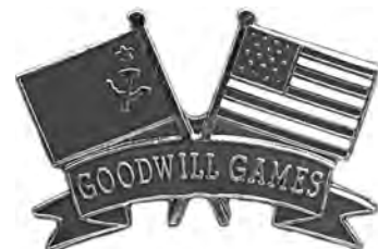
Ил. 51. Знак «Игры Доброй воли» американского производства. 1980-е гг. Аверс. КМТ.