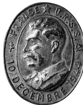
Ил. 23. Знак «Франция–СССР 10 декабря 1944», выпущенный Временным правительством Французской республики в честь заключения в Москве советско-французского договора о союзе и взаимной помощи. 1944 г. КМТ.

Интересен в этой связи французский френчский знак с профилем И.В. Сталина и датой «10 DECEMBRE 1944» (ил. 23). Этот знак отметил заключение 10 декабря 1944 г. в Москве советско-французского договора о союзе и взаимной помощи, его подписали наркомом иностранных дел Советского Союза В. М. Молотов и министр иностранных дел Временного правительства Французской Республики Ж. Бидо. Стороны обязались: продолжить совместную борьбу до окончательной победы над фашистской Германией; оказывать друг другу помощь и поддержку в этой борьбе всеми имеющимися средствами; не вступать с Германией в сепаратные переговоры и не заключать без взаимного согласия перемирия или мира, также СССР и Франция взяли на себя обязательство не заключать союзов и не принимать участие в коалициях, направленных против одной из договаривающихся сторон. 7 мая 1955 г. Президиум Верховного Совета СССР постановил аннулировать советско-французский договор, как утративший силу. Напомним, в 1949 г. Франция в первый раз вступила в НАТО, затем выходила из военной организации НАТО, оставаясь участницей политической структуры в 1966–2009 годах; ФРГ вошла в НАТО тоже как раз в 1955 г.