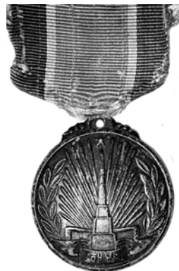
Ил. 35. Медаль КНДР «За освобождение Кореи». 1948 г. Аверс. КМТ.

Из дальневосточных наград не забудем и Северную Корею. История с этой страной не столь «локальна», как может показаться.