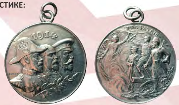
Ил. 27. Великобритания. Жетон «Pro Patria 1914» с портретами Георга V, Раймона Пуанкаре и Николая II. КМТ.