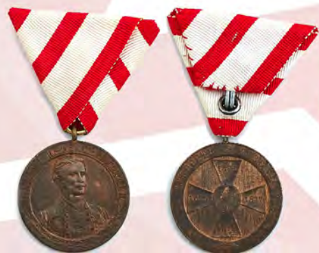
Ил. 16. Княжество Черногория. Медаль «В память войны за освобождение и независимость 1875–1878 годов». КМТ.