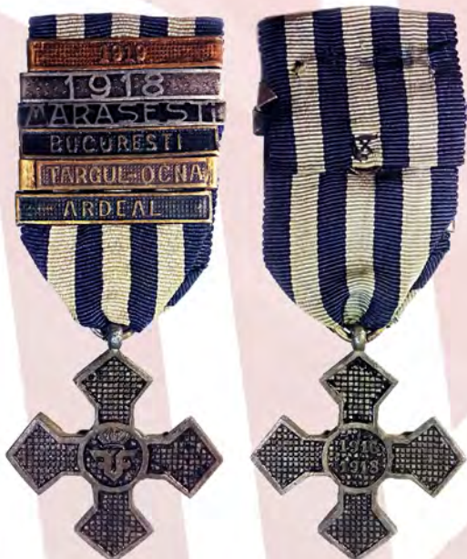
Ил. 32. Королевство Румыния. Памятный крест о войне 1916–1918 гг. с шестью планками с указанием боевых операций. КМТ.