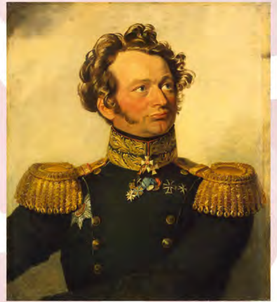
Ил. 4. Портрет генерал-майора Карла Ивановича Бистрома. Мастерская Джорджа Доу. 1819–1821. Холст, масло. 70×62,5 см. Военная галерея Зимнего Дворца, Государственный Эрмитаж. Инв. № ГЭ-8002.