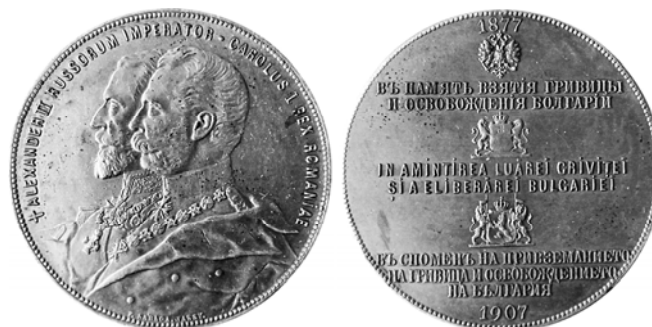
Ил. 19. Королевство Румыния. Жетон «В память взятия Гривицы и освобождения Болгарии». 1907. (отсутствует ушко для подвески). КМТ.