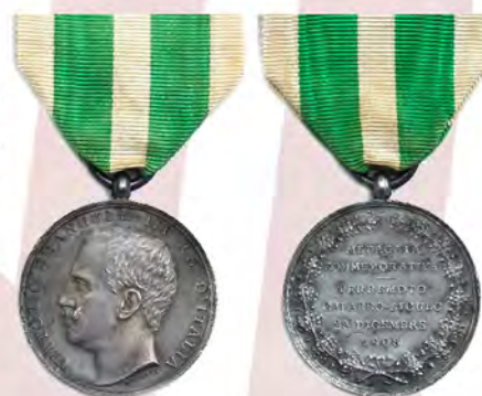
Ил. 24. Медаль «В память землетрясения в Калабрии и на Сицилии 28 декабря 1908 г.» на ленте второго типа (с 7 июля 1910 года). КМТ.