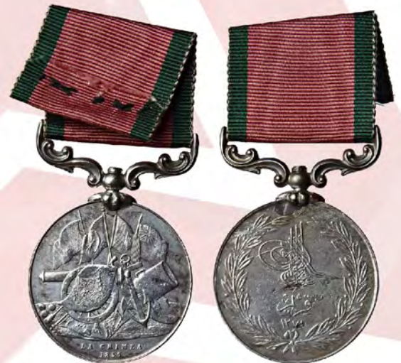
Ил. 8. Османская империя. Крымская медаль.