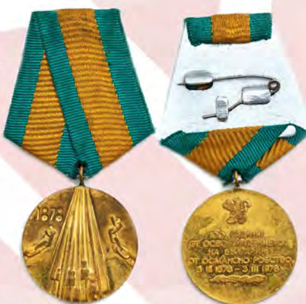
Ил. 20. Народная республика Болгария. Медаль «100 лет освобождения Болгарии от османского рабства». КМТ.