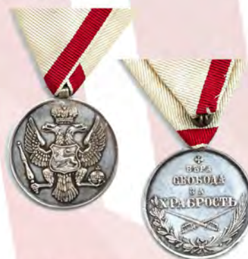
Ил. 15. Княжество Черногория. Серебряная медаль «За храбрость». КМТ.