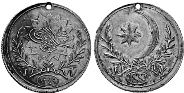
Ил. 6. Османская империя. Медаль для русского десанта на Босфоре. 1833.

Для большинства людей эти изображения ассоциируются с немецкими Железными крестами эмиссии 1914 и 1939 гг. и идентифицируются едва ли не подсознательно, как вражеский символ. В 1813 г. Пруссия была союзником России, и второе из трех прохождений нашей армией Берлина не было взятием (в отличие от 1760 и 1945 годов).