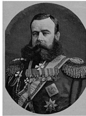
Ил. 22. Портрет генерала Михаила Дмитриевича Скобелева (1843–1882). Гравюра. 1880-е гг.

(для сравнения, император Александр III носил уже более позднюю версию медали образца 1880 г. в форме креста). На его последней прижизненной фотографии и гравюрах с нее она есть перед крестами Мекленбург-Шверин и Румынии (ил. 22).