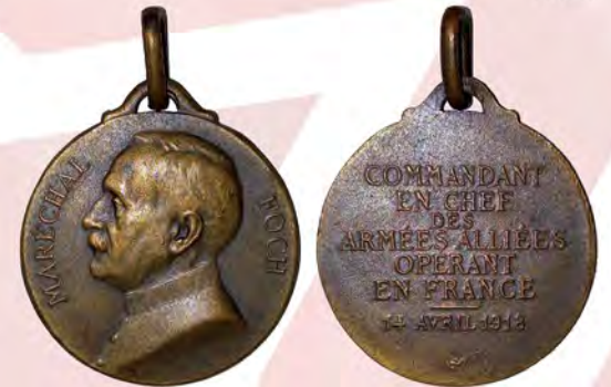
Ил. 29. Третья Французская республика. Жетон «Маршал Фош (1851–1929) верховный главнокомандующий вооруженными силами Антанты во Франции. 14 апреля 1918». Парижский монетный двор. КМТ.