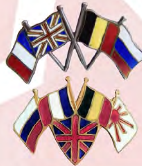
Ил. 28. Великобритания. Патриотические знаки Антанты с флагами стран-участниц (Франция, Великобритания, Бельгия, Россия; на втором знаке – Япония). 1914–1915. Фото: sammlung.ru