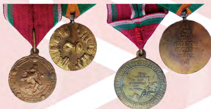
Ил. 17. Третье Болгарское царство. Медаль 25-летия Апрельского восстания. 1901; Народная республика Болгария. Медаль 100-летия Апрельского восстания. 1976. КМТ.