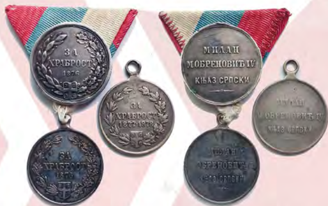
Ил. 14. Княжество Сербия. Серебряные медали «За храбрость» (1876; варианты изготовления, одна с утратой ушка) в Сербско-турецкой войне 1876–1877 гг.; и 1877–1878. КМТ.