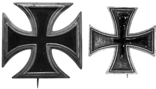
Ил. 3. Кульмские кресты. 1. Серебро, лак. 44x45 мм. Государственный Эрмитаж. Инв.№ ИО-24415. 2. Серебро. 38x38 мм. Государственный Эрмитаж. Инв.№ ИО-24414.