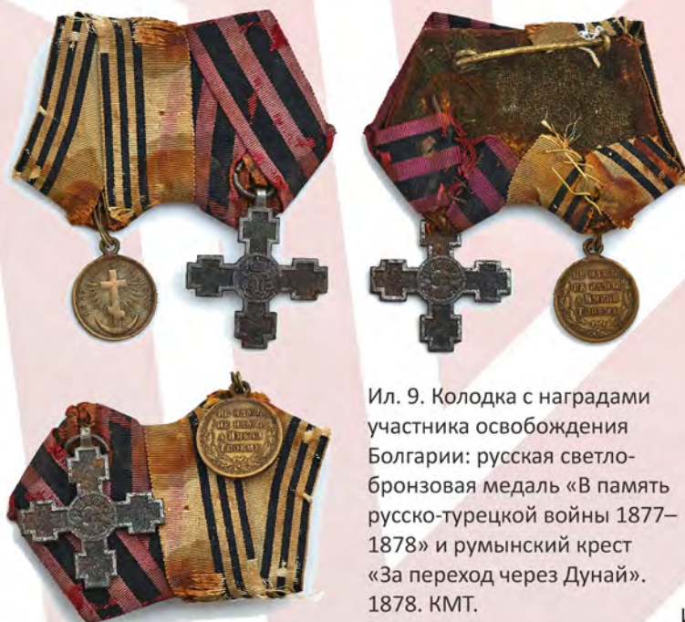
Ил. 9. Колодка с наградами участника освобождения Болгарии: русская светло-бронзовая медаль «В память русско-турецкой войны 1877–1878» и румынский крест «За переход через Дунай». 1878. КМТ.