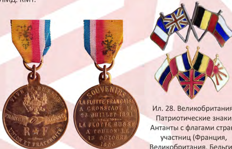
Ил. 26. Третья Французская республика. Жетон «Да здравствует Россия!» в память визита французской эскадры в Кронштадт в 1891 г. и русского флота в Тулон в 1893 г. КМТ.