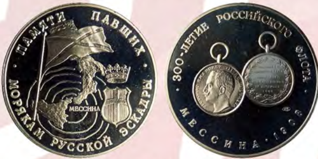
Ил. 25. Жетон «Мессина. 1908 / Памяти павших. Морякам русской эскадры» из серии «300-летие Российского флота». ЛМД. КМТ.