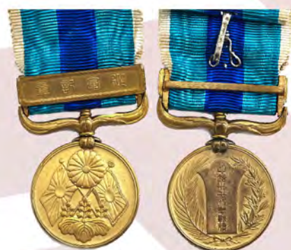
Ил. 23. Японская империя. Медаль за участие в Русско-японской войне 1904–1905 гг. 1906. КМТ.