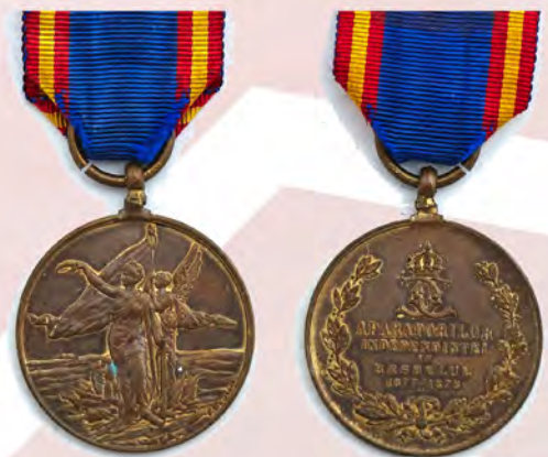
Ил. 10. Объединенное княжество Валахии и Молдавии. Медаль «Защитникам Независимости». 1878. КМТ.