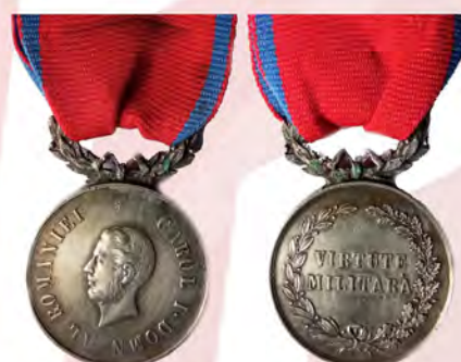
Ил. 21. Объединенное княжество Валахии и Молдавии. «Серебряная» медаль воинских заслуг образца 1872–1880 гг. КМТ.