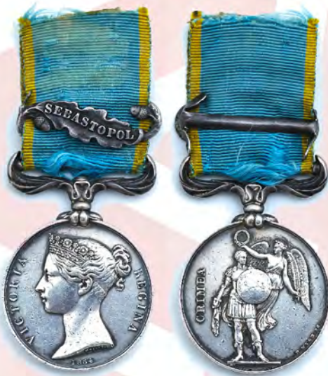
Ил. 7. Британская империя. Крымская медаль 1854 г. на оригинальной ленте с планкой «Севастополь» (1855). КМТ.