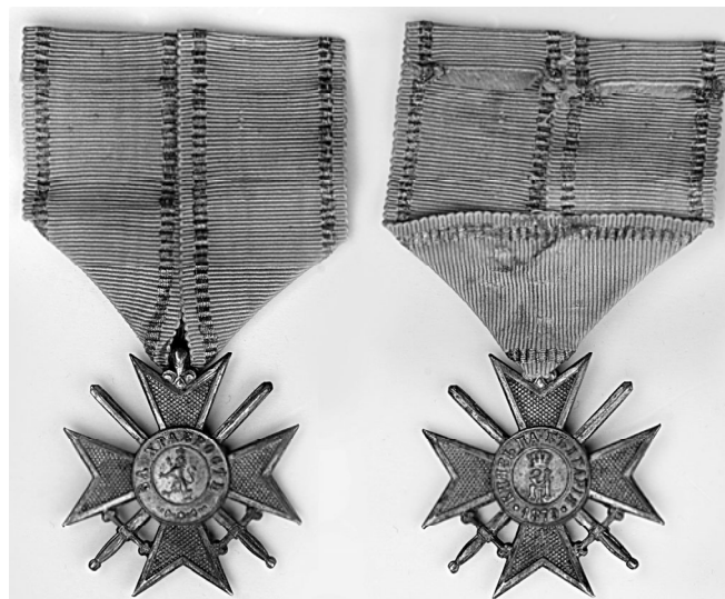
Ил. 12. Княжество Болгария. Крест воинский «За храбрость» 3-й степени первой т.н. «баттенберговой» эмиссии 1880 г., выпущенный в Вене. КМТ.

В Болгарии была практика ретроактивных награждений – награждений за поступок, совершенный до введения награды. Так, ветераны Русско-турецкой войны (в основном болгары, воевавшие в составе Болгарских дружин Русской армии) были награждены вновь учрежденным солдатским «За