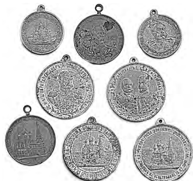
Ил. 18. Третье Болгарское царство. Памятные жетоны с портретом царя-освободителя Александра II «В память освящения Шипкинского монастыря и 25-летия освобождения Болгарии от Турецкого ига». Алюминий, бронза. 1902. КМТ.