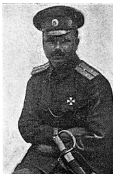
Ил. 1. Владимир фон Рихтер. Ротмистр. Портрет 3 .