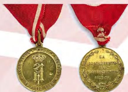
Ил. 11. Княжество Болгария. Медаль «За освобождение 1877–1878». 1880. КМТ.