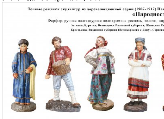
Точные реплики скульптур из дореволюционной серии (1907-1917) Пав. «Народност» Фарфор, ручная надглазурная полихромная роспись, золото, шир эстонка, Буритка, Великоорос Рязанской губернии, Женщина Ся Крестьянка Рязанской губернии (Великоороска с Доу), Сиртская

«Лучшее искусство – русский фарфор», – эти слова, сказанные в свое время замечательным художником, авторитетом своего времени в области искусства Михаилом Врубелем, по праву могут быть отнесены к изделиям первого российского фарфорового завода в Санкт-Петербурге. Именно здесь был раскрыт секрет «белого золота», здесь великими мастерами создавались настоящие шедевры, созвучные эпохе и даже опережающие её.