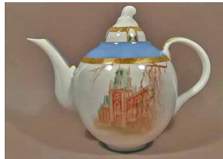
Чайник из сервиза «Векам грядущим в поученье...». Художник Н.Л. Петрова. ИФЗ, СПб. 2011 год. Собрание ГМЗ «Царицыно»