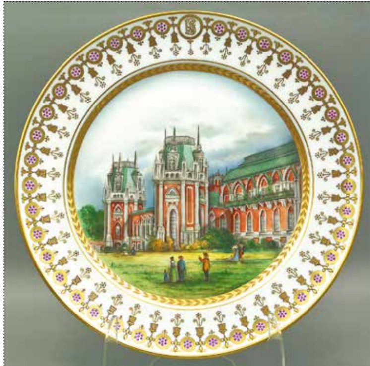
Тарелка 30 см из сервиза «Три века русской усадьбы» с изображением Большого дворца Царицына. Мастерская Лады Быстрицкой. СПб. 2019 год. Собрание С.Э. Шаитова и Н.В. Дворянчиковой

Наряду с усадебными видами появляется запрос на фарфор, в комплекс которого входили и городские ведуты. Примером этого служит Гурьевский (Русский) сервиз 1809–1816 годов (дополнения 1890 г.) 5 , названный по имени министра императорского двора, графа Дмитрия Александровича Гурьева. Это известный образец ампира, включающий столовую, десертную и чайную части, насчитывает более 600 предметов. В нём сочетаются темы — народы и типы России, виды Петербурга, Петергофа. Пожалуй, именно в Гурьевском сервизе общенациональный, энциклопедический характер жанра фарфорового сервиза соединился с его ампириной архитектурой оформления. Это во многом предопределило нераздельную связь образа усадьбы со стилем ампира, что произошло одновременно и в архитектуре своего времени.