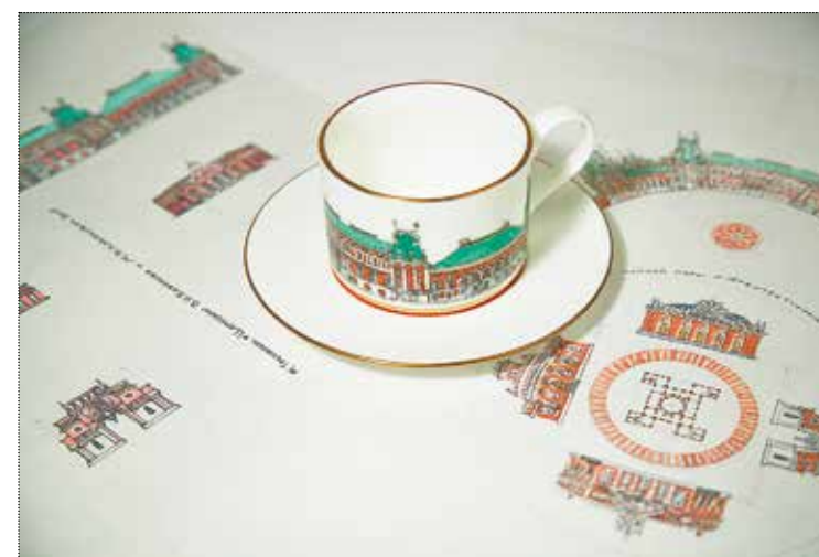
Чайная пара «Царицыно» и эскизы к ней. Художник М.М. Тренихин. ИФЗ, СПб. 2019 год. Собрание автора

что завершённых центральных царицынских строений, включая Большой кавалерский корпус 11 и корпуса дворцов императрицы и её наследников. Взамен них был построен величественный казачковский дворец, соразмерный только лишь Кухонному корпусу (Хлебному дому) и Среднему дворцу (Оперному дому). Поэтому мной был разработан проект чашки, на которой изображено грузное казачковское творение, допол-