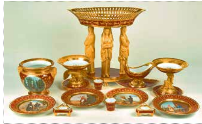
Предметы Гурьевского сервиза. Императорский фарфоровый завод. 1809–1816 годы. Собрание ГМЗ «Петергоф»

зацию подмосковных Горок (Ленинских), пушкинских мест и классических видов Ленинграда, а также крымских курортов, наряду с уподобленными этой традиции павильонами ВСХВ, усадьба в фарфоре встречается эпизодически. Достаточно курьёзным примером здесь служат выпущенные по спецзаказам в 1970–е годы образцы посуды для санаториев, размещённых в бывших усадьбах. Примером этому служат чашки из санатория в имении Волынщина-Полуктovo и другие.