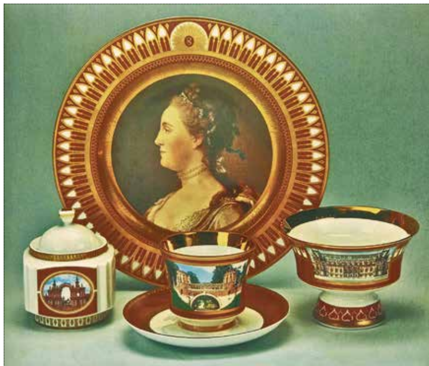
Сервиз «В честь воссоздания ГМЗ «Царицыно» Правительством Москвы». Автор росписи М.Ю. Зонова. ИФЗ, СПб. 2005–2007 годы. Собрание Фонда «Наследие» АО «ИФЗ»