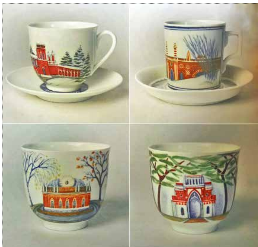
Серия чашек «Царицыно». Художник Г.Д. Шуляк (1944–2021). ИФЗ, СПб. 2013–2014 годы. Собрание Фонда «Наследие» АО «ИФЗ»

В.Ф. Аммона 1835 года из собрания ГНИМА им. А.В. Щусева, украсил одну из сторон супницы и очень удачно расположен. Этот вид примечателен тем, что на нём ещё можно видеть остатки временных дворцовых крыш, которые позднее разрушатся. Но для тарелки с видом большого дворца избранный образец был переработан в соответствии с современным обликом Большого дворца, отличающимся от первоначальных проектов М.Ф. Казакова 8 .