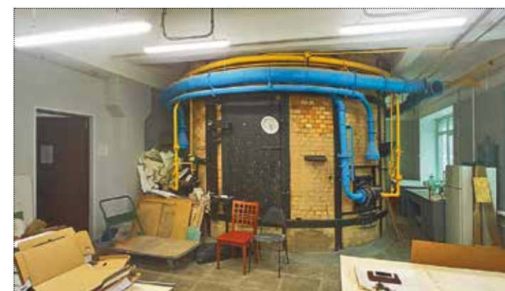
Керамический цех. Уникальный горн, на высоту всего здания, где обжигали керамику. март 2022 года

Некоторые образцы Ассортиментного комбината – произведения из керамики и металла (порядка 1300 единиц), а также остатки архива были переданы в музей-заповедник «Царицыно». И эти произведения после их обработки заслуживают отдельного рассказа.