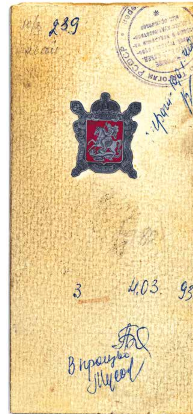
Эскиз значка с гербом Московской губернии. 1993 год. Частное собрание

Надо отметить, что даже упаковочные ленты с использованием логотипа ЭТПК, которыми оклеивали коробки и коробки с продукцией, выглядят очень стильно.