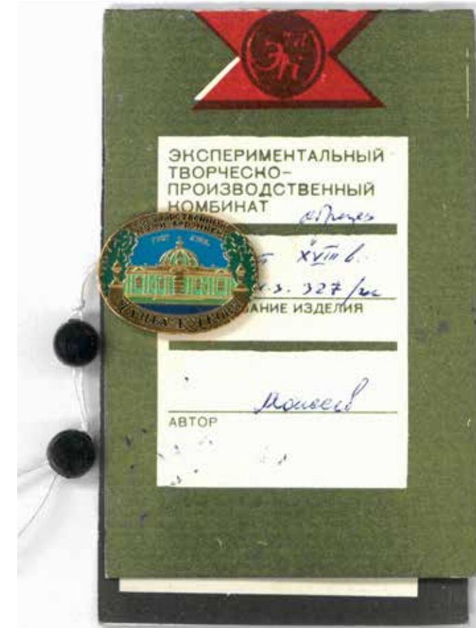
Значок «Государственный музей керамики. Усадьба Кусково. Павильон Грот». Художник Моисеев. 1985 год. Тираж 5000 штук. Частное собрание