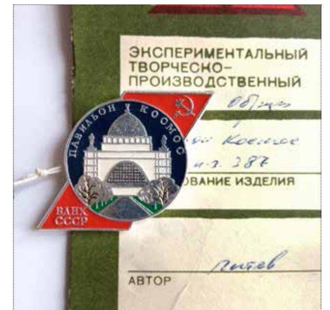
Значок «ВДНХ СССР. Павильон Космос». Художник Питев. 1986 год. Тираж 10 000 штук. Частное собрание

на металлизированный картон. Эта техника ближе к конечному изделию, но шарм тончайших ручных прорисовок пропадает.