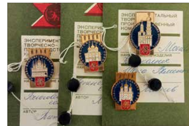
Значки из серии Московского Кремля: Успенский, Архангельский, Благовещенский соборы, колокольня Ивана Великого. Художник Питев. 1990 год. Тираж – 10 000 штук. Частное собрание