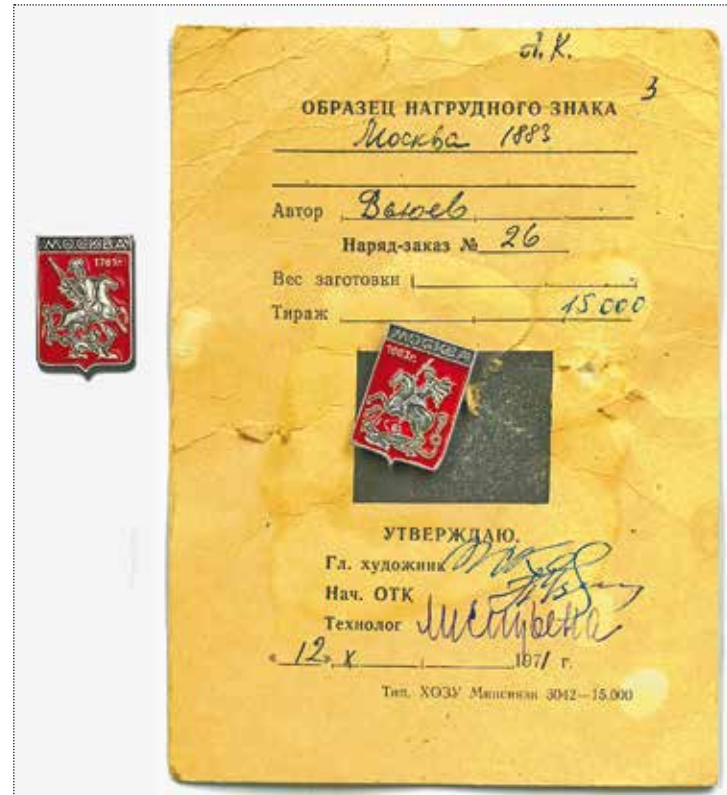
Знак с гербом Москвы 1781 года и образец знака с гербом Москвы 1883 года на заводском паспорте изделия. Художник Павел Ильич Вьюев. 1971 год. Тираж 15 000 штук. Частное собрание

из себя объекты охоты коллекционеров совершенно разных направлений. Но на примере только одного этого производства интересно проследить то, как в советское время готовились и утверждались значки. И это не столько простой процесс, как может показаться с высоты сегодняшнего дня.