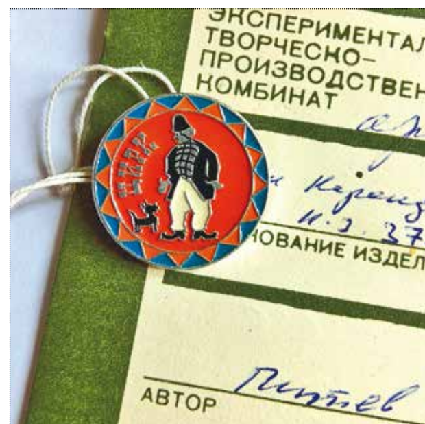
Образец значка «Цирк» с клоуном Карандашом. Художник Питев. 1989 год. Тираж 10 000 штук. Частное собрание