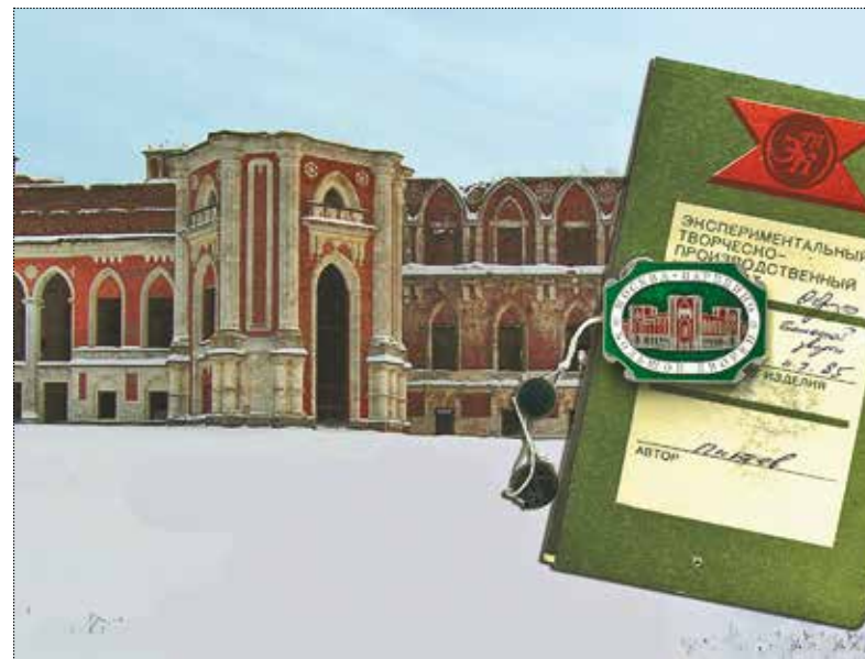
Образец знака «Царицыно. Большой дворец» с паспортом изделия и пломбой. Художник Питев. 1990 год. Тираж 10 000 штук. Частное собрание. Само собой, дворец изображён без шатров, в виде руины, в котором он пребывал до реконструкции 2007 года

Как представить музей? В основном они располагаются в стенах архитектурных памятников. И изображая здание, передаёшь образ музея. Как правильно. Тут, правда, есть интересные исключения. Например, для одного из