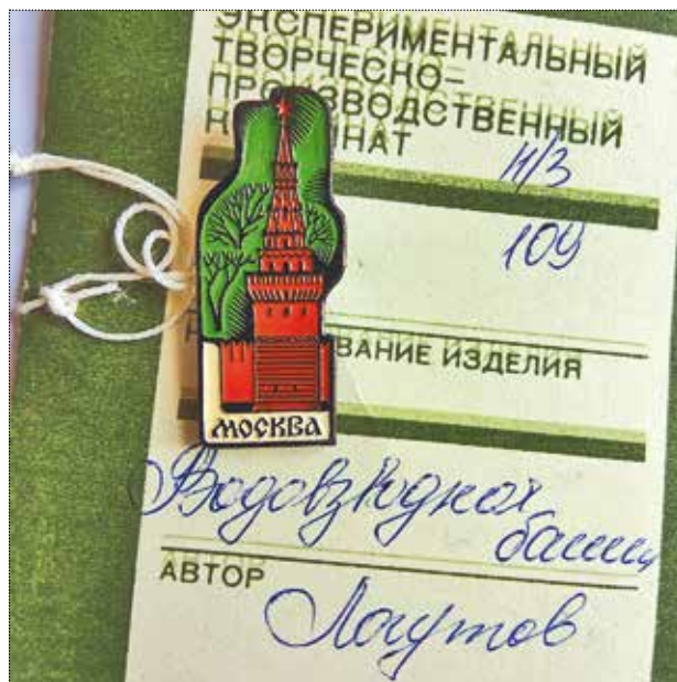
Значок «Водовзводная башня Московского Кремля». Художник Локутов. 1990 год. Частное собрание