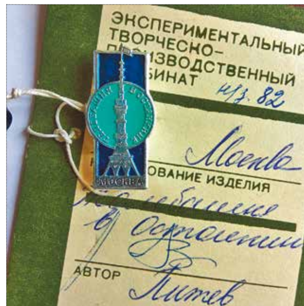
Значок «Москва. Телебашня в Останкине». Художник Питев. 1990 год. Тираж 10 000 штук. Частное собрание