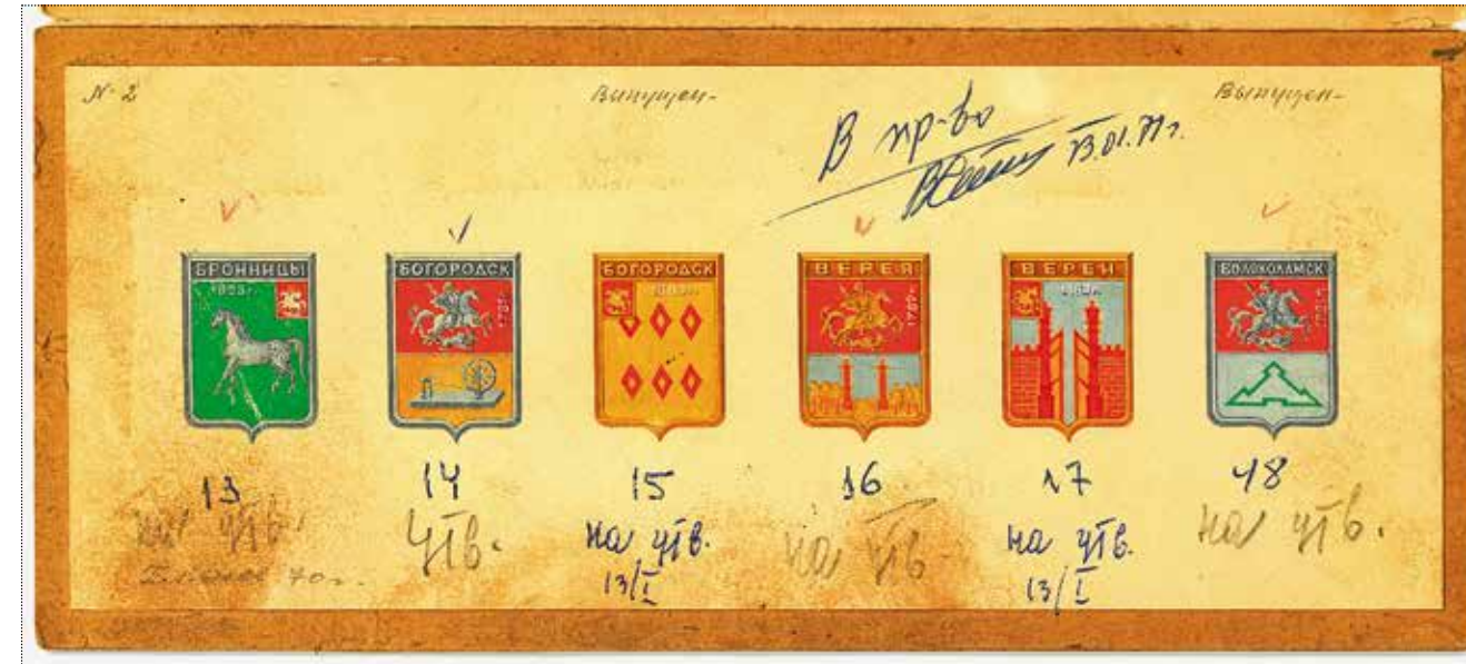
Эскизы гербов городов Бронницы, Верея, Богородск, Волоколамск. Художник Корнеев. 1970 год. Частное собрание

Сотрудник Государственного исторического музея из отдела нумизматики согла-