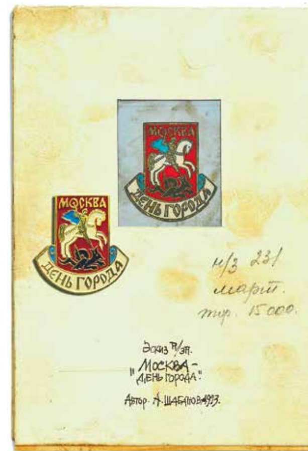
Эскиз значка «Москва. День города» и сам значок. Художник А. Шабанова. 1993 год. Тираж 15 000. Частное собрание

ному искусству при исполкоме Московского Совета народных депутатов». Весомо!