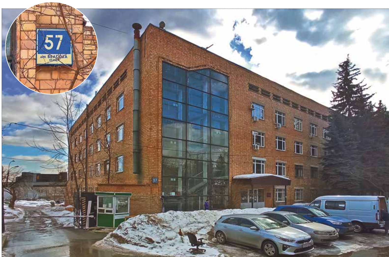
Снесённое здание Экспериментального творческо-производственного комбината на улице Архитектора Власова, 57. 1965–2022. март 2022 года

Аббревиатура ЭТПК хорошо знакома коллекционерам-фалеристам и специалистам в области декоративно-прикладного искусства. Для первых это прежде всего круглое клеймо на оборотах значков, для вторых, художников и искусствоведов, – бурная работа по производству авторских образцов художественной керамики, стекла и металла. Но что это за предприятие и чем оно знаменито?