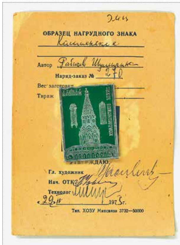
Образец нагрудного знака «Коломенское» с изображением церкви Вознесения Господня, резными каменными оконными наличниками и дворцом царя Алексея Михайловича. Художники Рабинович и Шумилина. 1973 год. Частное собрание

Паспорта изделий ЭТПК изменились с конца 1970-х годов и стали похожи на вертикальную книжечку. В этих раскладушках стало уместиться много информации, которая сегодня уточняет и авторство, и дату создания, и процесс утверждения и реализации продукции. Значки обязательно крепились на нитку с пломбами.