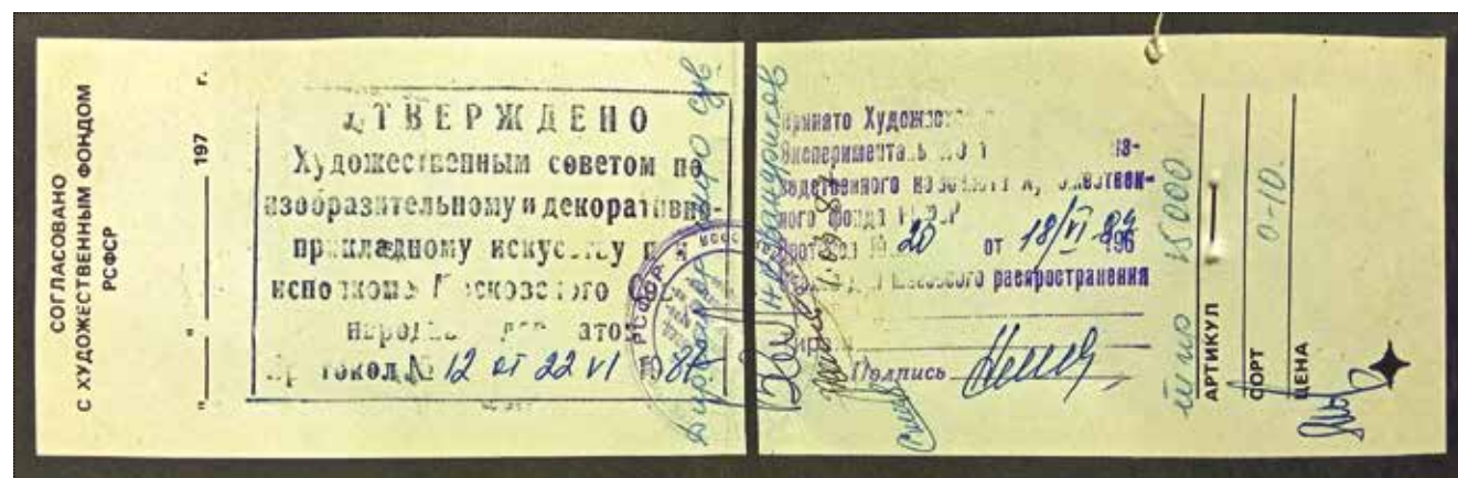
Разворот паспорта значка ЭТПК с заверяющими печатями Художественного совета по изобразительному и декоративно-прикладному искусству при исполкоме Московского Совета народных депутатов, Художественного Совета Экспериментального творческо-производственного комбината Художественного фонда РСФСР и Московского центрального объединения оптовой торговли сувенирами и изделиями народных художественных промыслов. Макет паспорта конца 1980-х годов