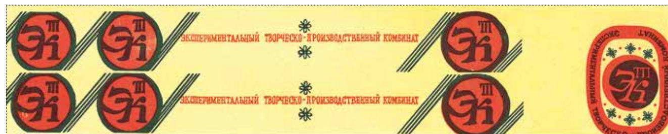
Упаковочная лента ЭТПК