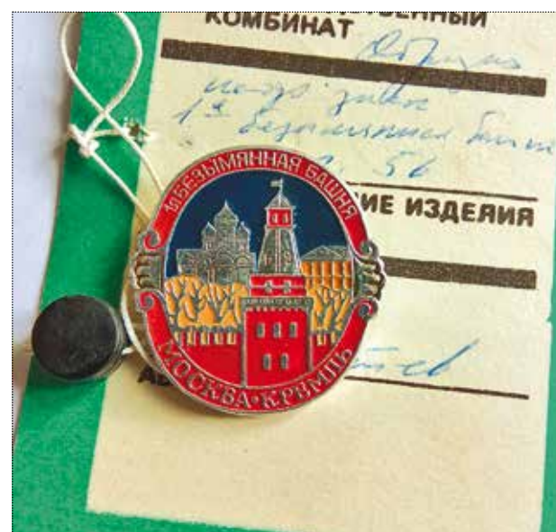
Значок «Москва. Кремль. Безымянная башня». Художник Питев. 1988 год. Тираж 10 000 штук. Частное собрание