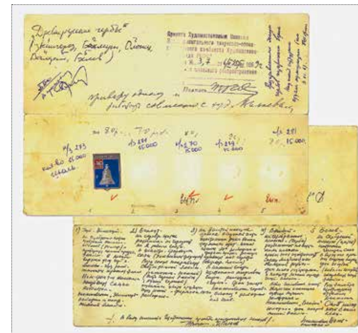
Эскиз герба Звенигорода с ремаркой научного сотрудника отдела нумизматики ГИМ П. Шорина. Художник Павел Ильич Вьюев. 1969 год. Частное собрание

Образцы знаков крепились на специальных паспортах изделия. Интересно, кстати, что даже то, что не поворачивается называть солидным словом «знак» и хочется обозначить как «значок», всё равно называлось «образцом нагрудного знака». Эти коллизии нередко встречаются в обсуждениях коллекционеров: «Ещё принципиальный нюанс: нет чёткой границы между «значком» и «знаком» ни на уровне бытования предметов (существует набор признаков, отделяющих один тип от другого,