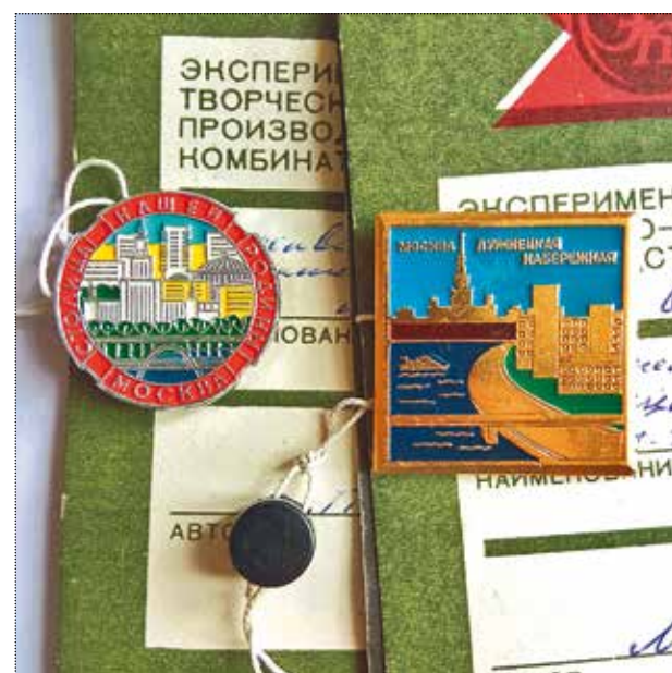
Значок «Столица нашей Родины – Москва». Художник Питев. 1989 год. Тираж 5000 штук. Значок «Москва. Лужнецкая набережная». Художник Моисеев. 1988 год. Тираж 5000 штук. Частное собрание