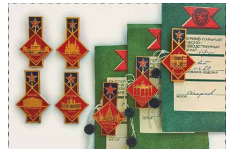
Значки из серии достопримечательностей Москвы. Художник Погорелов. 1988–1989 годы. Тираж – 15 000 штук. Частное собрание

Знак ЭТПК «Всероссийский музей декоративно-прикладного и народного искусства» с изображением вазы с подцветом «золотого рубина». Императорский стеклянный завод. Россия, Санкт-Петербург. 1830-е годы. Стекло, бронза, гранение, золочение. Высота 56,0 см