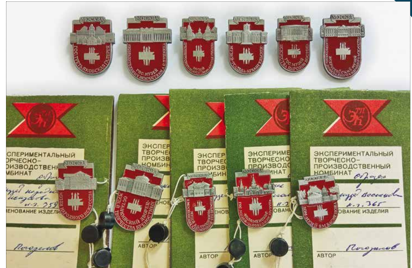
Знаки из серии художественных музеев. Художник Погорелов. 1988–1989 годы. Тираж – 15 000 штук. Частное собрание. Останкинский дворец указан ещё как Музей творчества крепостных