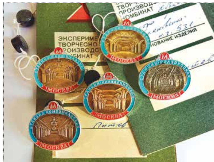
Значки станций Московского метрополитена: «Парк Культуры», «Маяковская», «Комсомольская», «Кропоткинская», «Белорусская». Художник Питев. 1989 год. Тираж – 10 000 штук. Частное собрание