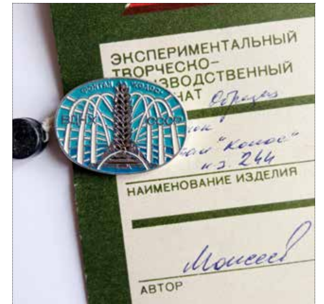
Значок «ВДНХ СССР. Фонтан Колос». Художник Моисеев. 1988 год. Тираж 5000 штук. Частное собрание