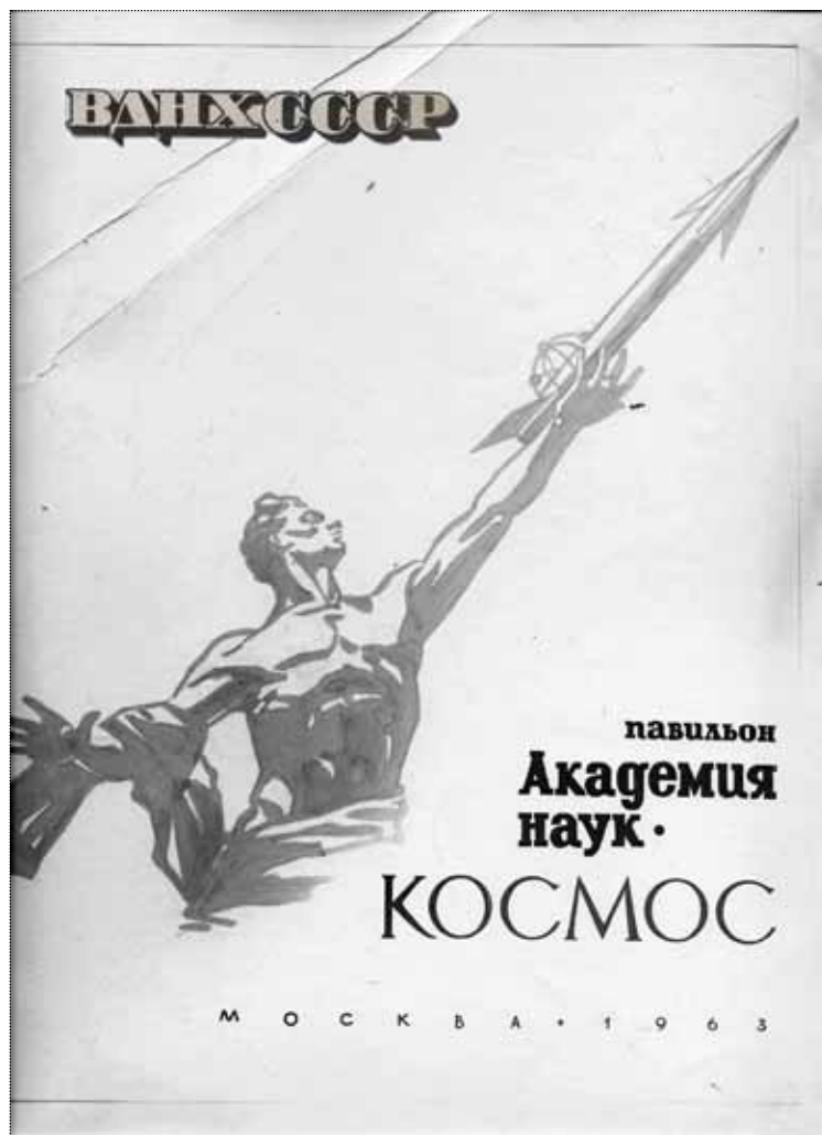
А.В. Борисов. «Павильон Академии Наук СССР «Космос»». Обложка рекламного буклета «ВДНХ СССР». Коллаж. 1965–1967 годы

ем создания синтеза искусства и жизни, в противовес предшествовавшим в 1940–1950-е годы отвлечённо-идеалистическим тенденциям. Искусство уже не пыталось подменять жизнь, а реагировало на изменение её течения, ритма и динамики. Повседневная жизнь возвышалась, художественное творчество демократизировалось, как и его аудитория.