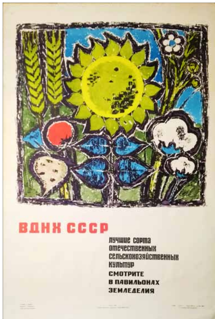
А.В. Борисов. Плакат «Лучшие сорта отечественных сельскохозяйственных культур смотрите в павильонах земледелия». 1967 год. Тираж 2000 экз.

работ для ВДНХ СССР. В семье сохранились макеты для буклетов и путеводителей по выставке. Интересна минималистская эстетика работ для ВДНХ, по которой практически безошибочно угадывается время. Если посмотреть на обложки и виньетки, на их композицию и цветовое решение сразу становится понятно, что это — шестидесятые. Всё делалось вручную, не было в то время ни персональных компьютеров, ни хитрых программ для обработки изображений и верстки книг.