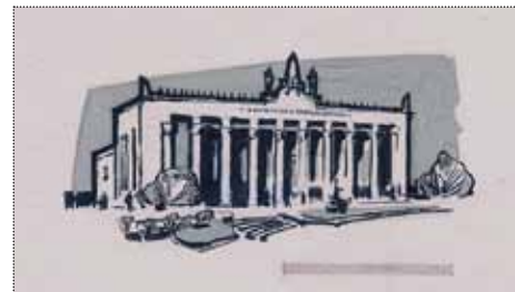
А.В. Борисов. «Павильон “Химическая промышленность”». Виньетка для рекламного буклета «ВДНХ СССР». Бумага, белила, тушь. 1965–1967 годы

К слову, Анатолий Борисов был принят в Союз художников СССР в 1968 году всего за год до смерти.