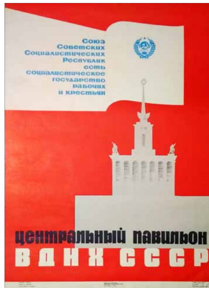
А.В. Борисов. Плакат «Центральный павильон ВДНХ». 1965 год. Тираж 2000 экз.

дома, знаменитые хрущёвки! Павильон «Космос»? Какая устремлённость ввысь, стремление к новому, мир расширился и бурлил энергией! Новые приборы в области здравоохранения, развитие топливной промышленности и животноводства, творчество юных умельцев и физическое воспитание учащихся. Отражение жизни всей страны! «Лучшие образцы современной техники, прогрессивные методы и приёмы труда, новые технологии промышленного, строительного и сельскохозяйственного производства, успехи советской науки и культуры, проводимые на ВДНХ СССР мероприятия: тематические выставки и смотры, семинары, школы передового опыта, научно-технические совещания и конференции» – если говорить фразами рекламных листовок того времени. И как обобщение – самый, если можно так выразиться, обязательно-номенклатурный плакат – Центральный павильон с девизом