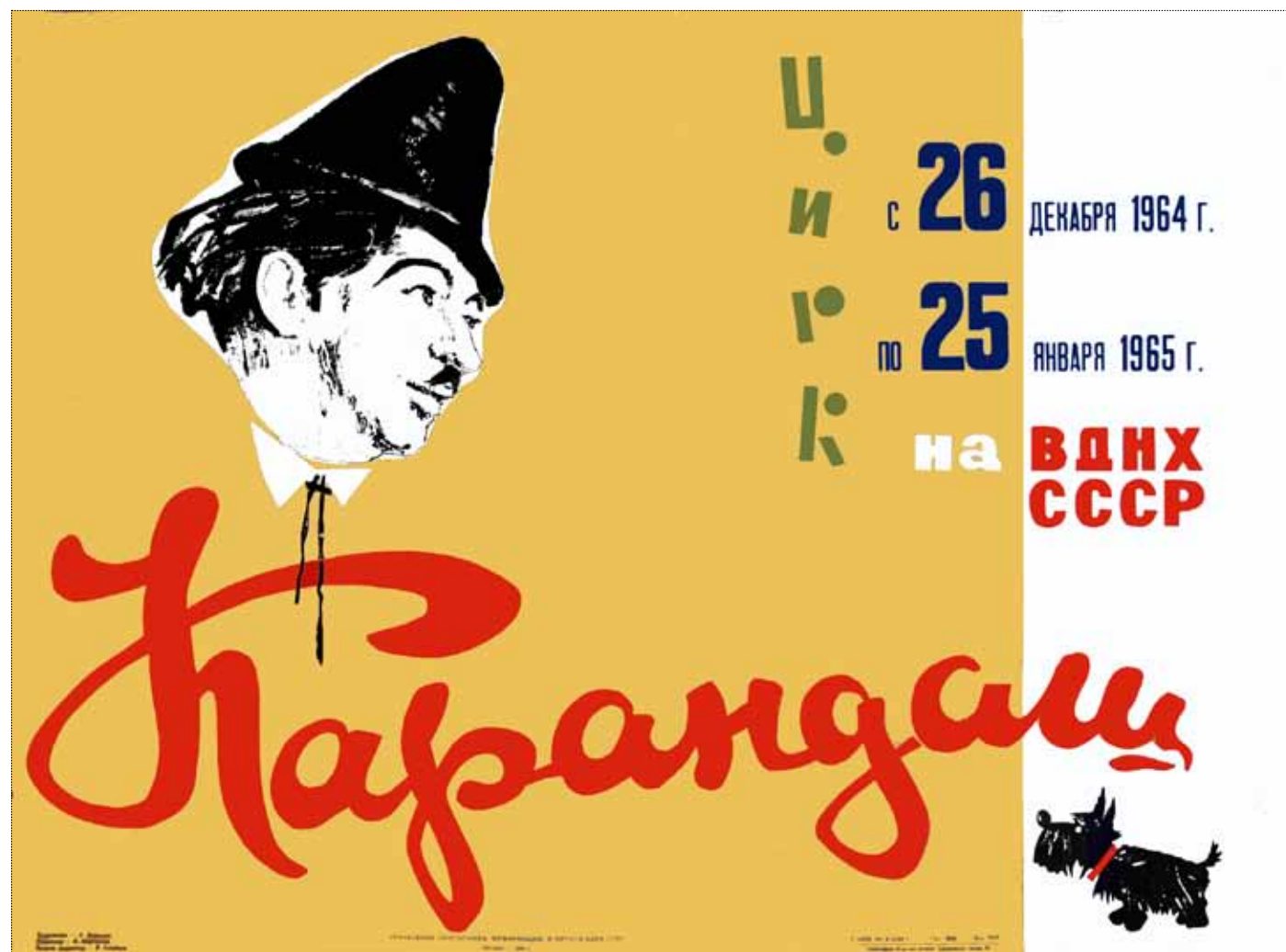
Афиша «Карандаш. Цирк на ВДНХ СССР (с 26 декабря 1964 г. по 25 января 1965 г.)». 1964 год. Тираж 3000 экз.