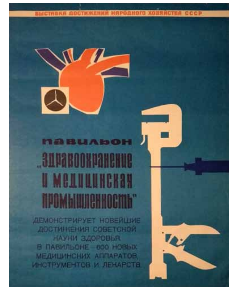
А.В. Борисов. Плакат «Павильон “Здравоохранение и медицинская промышленность” ВДНХ СССР». 1965–1967 годы

Вообще искусство шестидесятников иногда воспринимается как тяжеловесное, чрезмерно социально ориентированное и прямолинейное, а с другой стороны, как давшее начало свободе творческой мысли от ограниченных представлений, как программный антиакадемизм и живое