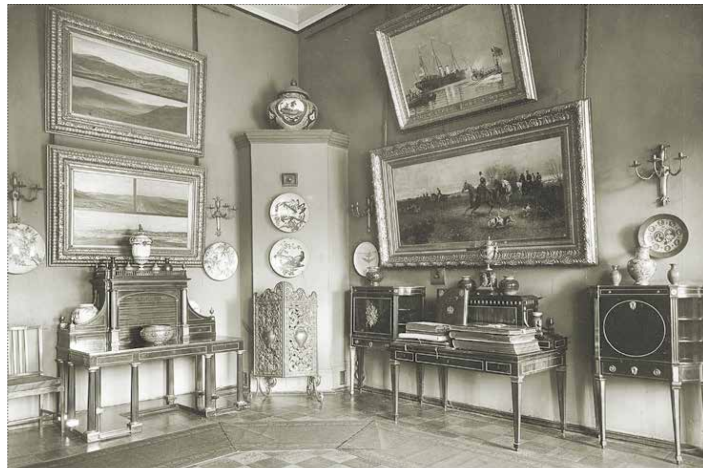
Подобное блюдо (на фото справа) висело в кабинете императора Александра III в Гатчинском дворце

В музее-заповеднике «Царицыно» в экспозиции «Екатерина II. Золотой век Российской империи» представлено интересное высокохудожественное блюдо. Оно привлекает внимание не только тончайшей работой, но, вначале, обилием портретов императоров. Два больших портрета в фас в овальных медальонах и восемь в маленьких круглых медальонах, напоминающих не то рельефы на монетах, не то резные геммы.