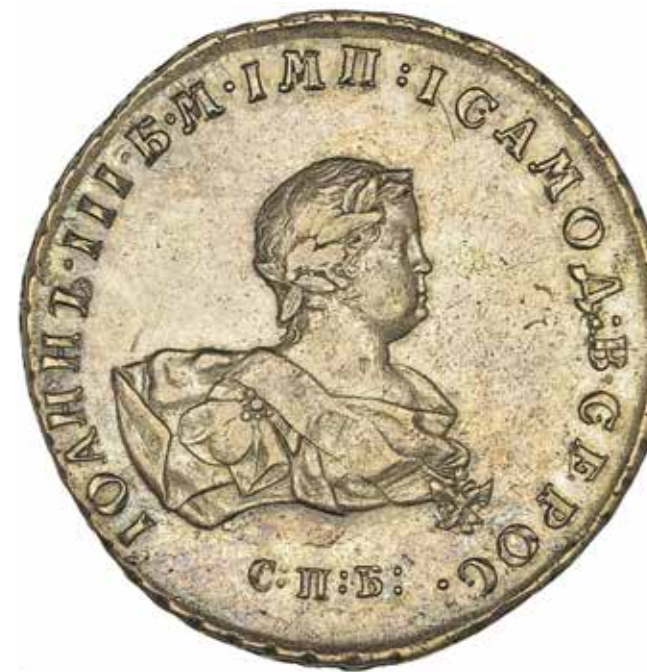
Рубль Иоанна III (в современной традиции его называют Иваном VI). 1741 год. Музей истории денег, Санкт-Петербург.