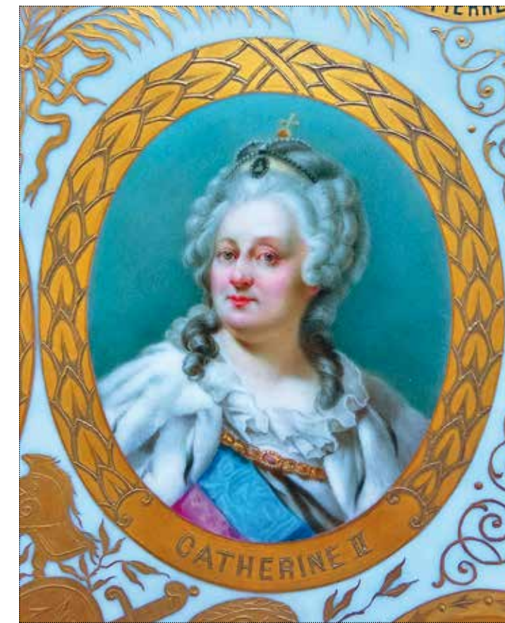
Фрагмент блюда с портретом Екатерины II. ГМЗ «Царицыно». Инв. Ф-2726

В эпоху Просвещения высшие слои общества не могли не осознавать, что свод законов, принятый земским собором в середине XVII века, задолго до петровских преобразований, безнадежно устарел. Уложенная комиссия 1797 года создавалась по инициативе Екатерины II для выработки законов для всех сословий Российской империи, в итоге хотя эта задача не была выполнена, но дала обширный и ценнейший материал о нуждах и чаяниях всех слоёв населения империи. Восемь первых заседаний комиссии были посвящены чтению большого наказа, обряда управления и определению о поднесении Екатерине II пышного титула «Великой Екатерины, Премудрой и Матери Отечества». Екатерина в записке А.И. Бибикину ответила: «Я им велела сделать русской империи законы, а они делают апологию моим качествам». В конечном счёте она оставила за собой титул Матери Отечества, отклонив два других, на том основании, что значение её дел («Великая») определит потомство, а «Премудрая» – потому, что премудр один Бог. Как показывает практика, уже при её внуке, восстанавливаю-