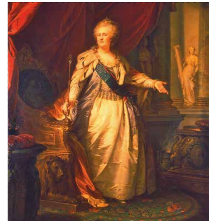
Портрет Екатерины II. И.Б. Лампи Ст. 1793 год. ГЭ