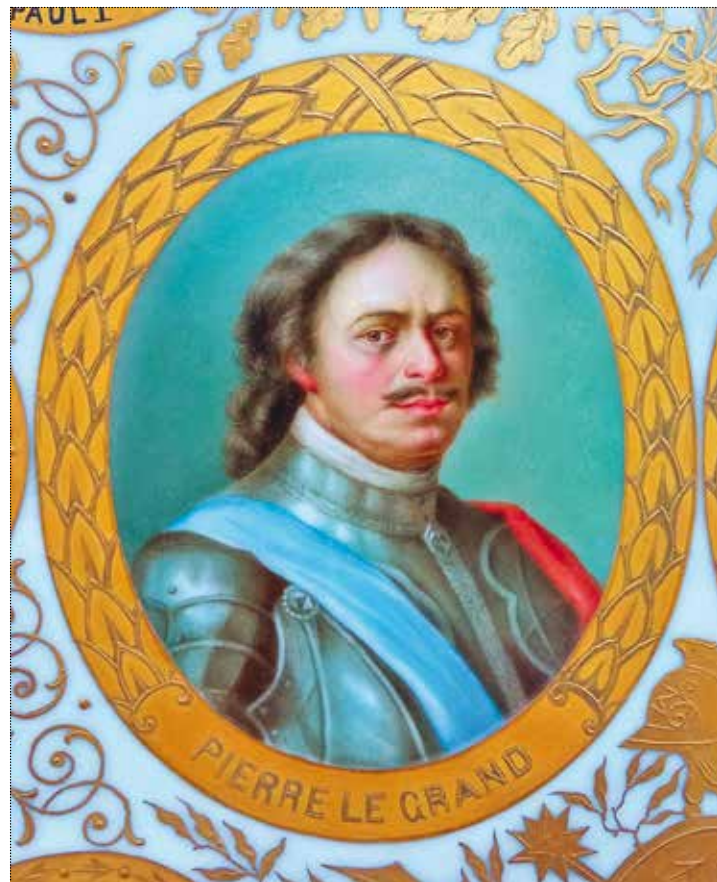
Фрагмент блюда с портретом Петра I. ГМЗ «Царицыно». Инв. Ф-2726

То есть, на нём запечатлены все монархи века XVIII-го и первый XIX-го, о чём гласит и надпись на обороте на французском языке: «Les Souverains russes depuis Pierre le Grand jusqu'à Alexandre I». Блюдо изготовлено мастерами Венской Королевской фарфоровой мануфактуры (нем. Wiener Porzellanmanufaktur), первой в империи Габсбургов, созданной в 1718 году (стала второй крупной мануфактурой в Европе после Майсенской). Марка завода подглазурная серая в виде стилизованного изображения австрийского герба.