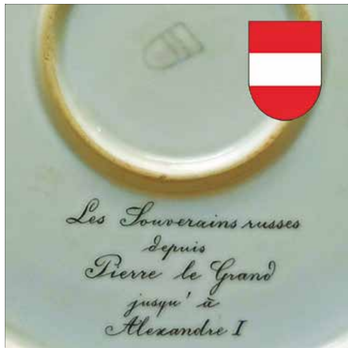
Блюдо. Австрия, Венская фарфоровая мануфактура. Марка и подпись на обороте. ГМЗ «Царицыно». Инв. Ф-2726

ший всего три года и скончавшийся от оспы в 1730 году; Анна Иоанновна, чьё десятилетнее правление запомнилось «бироновщиной» по имени её фаворита Эрнста Бирона; император-младенец Иван VI, царствовавший с октября 1740 по ноябрь 1741 года; свергнувшая младенца Елизавета Петровна, правление которой отмечено восстановлением учреждением Московского университета и первого в России Императорского фарфорового завода (до 1765-го – Невская порцелиновая мануфактура); владетельный герцог Гольштейн-Готторпский, ставший императором Петром III; София Августа Фредерика Ангальт-Цербстская, правившая Россией более тридцати лет и вошедшая в историю под именем Екатерины Великой; рыцарь на российском троне, Великий магистр Мальтийского ордена Павел I. Завершает срез отечественной истории за столетие портрет Александра I, позднее удостоенного особого эпитета в русской историографии – «Благословенный».