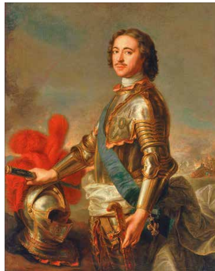
Портрет императора Петра I. Жан-Марк Наттье, 1717 год. Холст; масло. 142,5 × 110 см. ГЭ. Инв. ЭРЖ-1856

царствования Людовика XV и крупнейшего портретиста середины XVIII века – французского художника Жан-Марка Наттье (1685–1766). Оригинал портрета имеется в Государственном Эрмитаже.