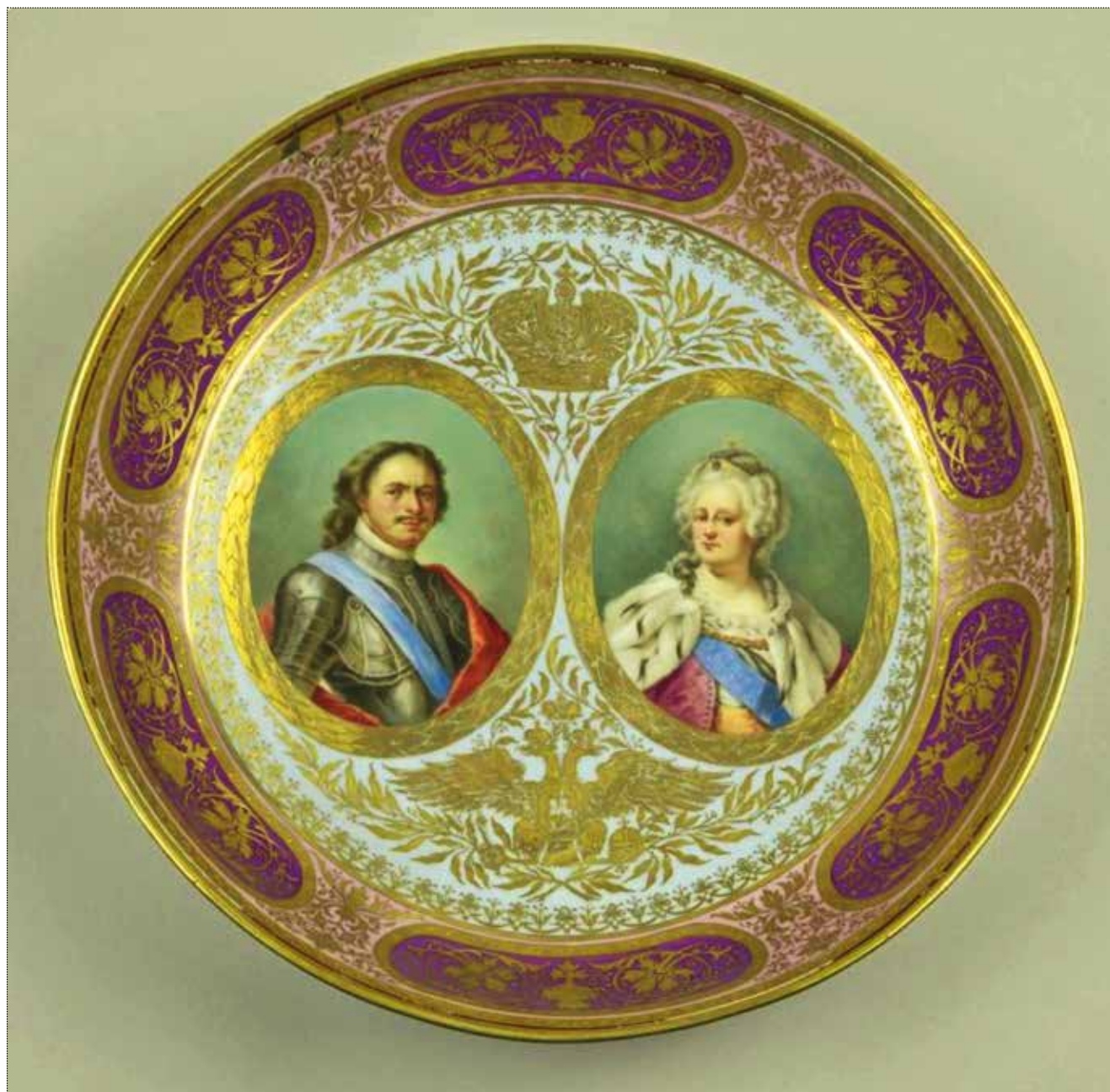
Блюдо. Австрия, Венская королевская фарфоровая мануфактура. Последняя треть XIX века. Фарфор, надглазурное крытье, надглазурная роспись, паста, золочение, цировка. Высота: 5,6 см; Диаметр: 25,4 см. ГИМ 42567/4876. Инв. 5343 фф. Номер в Госкаталоге: 24681121. Государственный каталог музейного фонда Российской Федерации. Режим доступа: https://goskatalog.ru/portal/#/collections?id=24826099