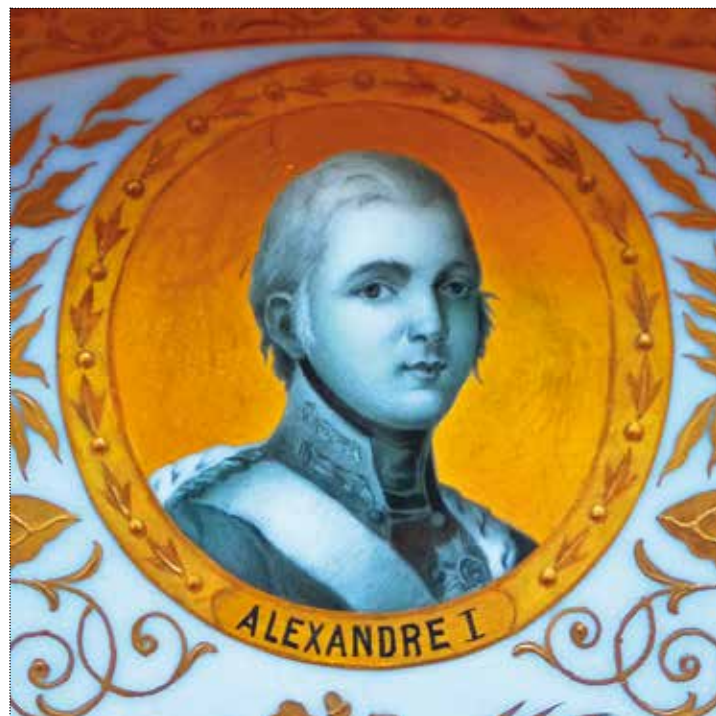
Фрагмент блюда с портретом Александра I. ГМЗ «Царицыно». Инв. Ф-2726