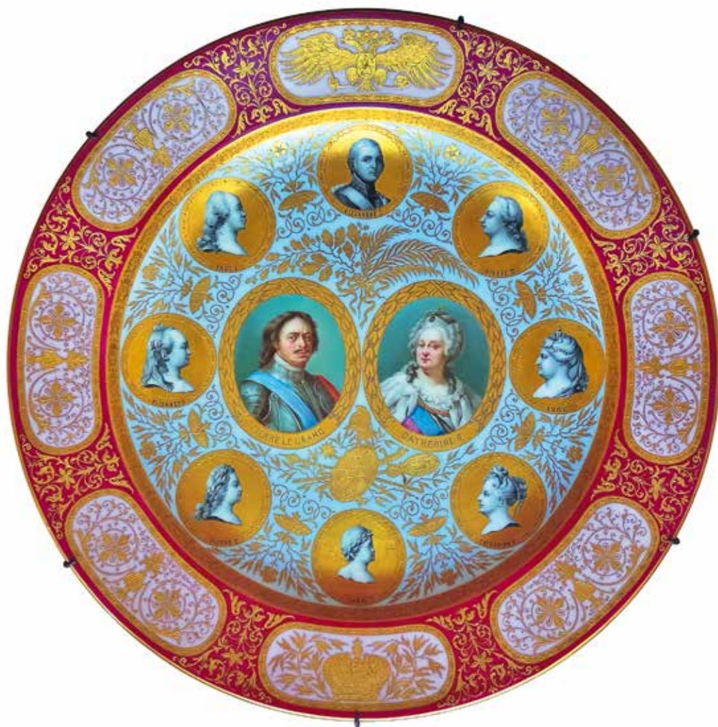
Блюдо. Австрия, Венская фарфоровая мануфактура. 1800–1810-е годы. Фарфор, крыльё и роспись надглазурные, золочение. ГМЗ «Царицыно». Инв. Ф-2726

В музее-заповеднике «Царицыно» в экспозиции «Екатерина II. Золотой век Российской империи» представлено интересное высокохудожественное блюдо. Оно привлекает внимание не только тончайшей работой, но, вначале, обилием портретов императоров. Два больших портрета в фас в овальных медальонах и восемь в маленьких круглых медальонах, напоминающих не то рельефы на монетах, не то резные геммы.